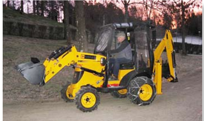
Harald Hogstad kjører de første meterne med den nye traktorgraveren.