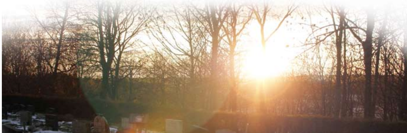
Vinterutsikt fra Trøgstad kirke