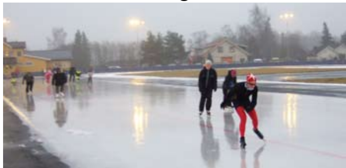
Skikkelig på glattisen! Det ble gått ca. 75 mil på Villbåstingen.

Den 16. utgaven av skøyteøpet Villbåstingen ble arrangert søndag 11. januar. Det ble en forblåst opplevelse.