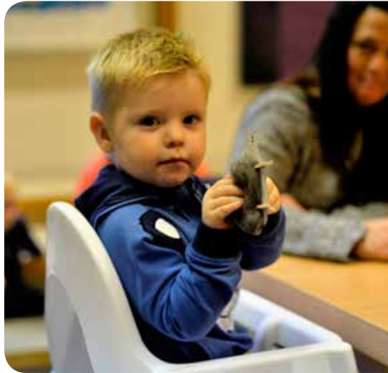
Det ble en fiin sau det.

Avslutningen var ved lysgloben med lystenning før de fikk med seg boka om "Lille sau går seg vill" hjem.