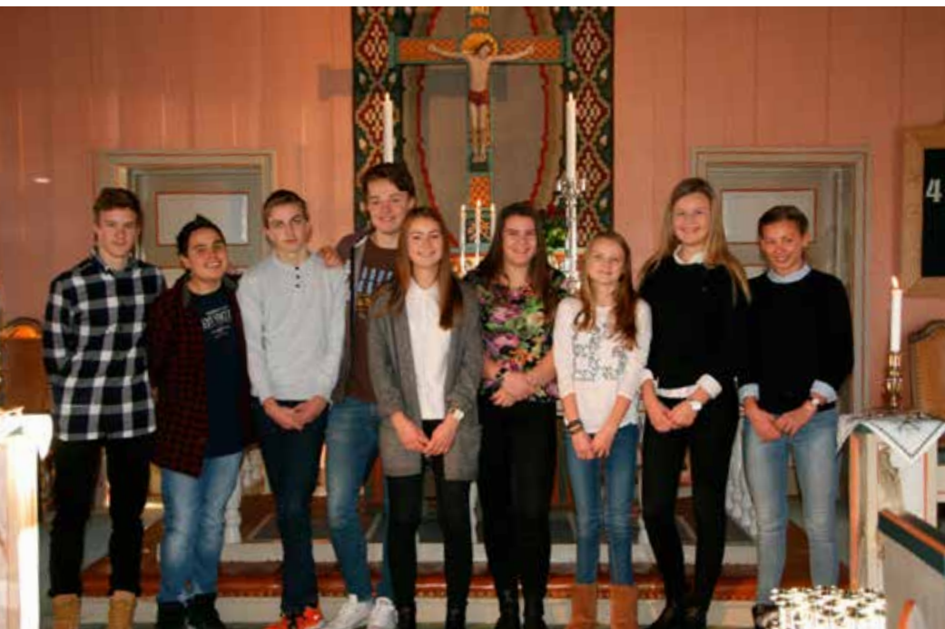
Årets konfirmanter på Rømskog