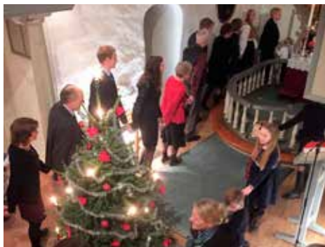
I flere av kirkene våre går de som har lyst rundt juletreet på julaften. Her fra gudstjenesten i Rødnes kirke.