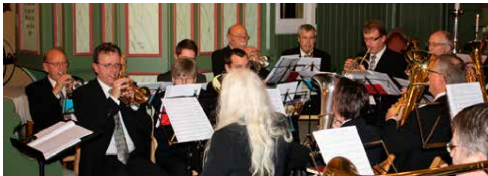
Slusebrass fra "Adventstener" i Klund kirke.