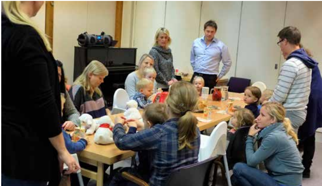
Her lages sauer, mange sauer.