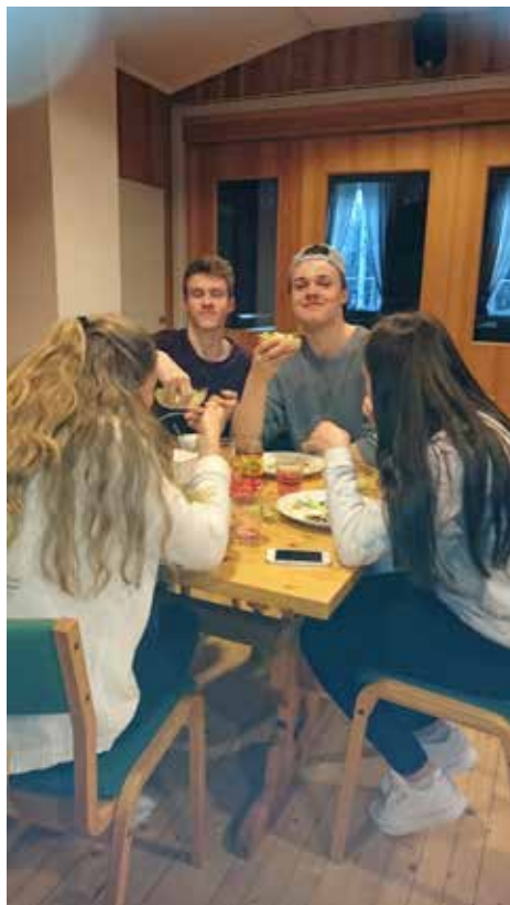
Vedlagt foto: På Rømskog har bestemorere i årevis stilt opp hver eneste gang konfirmantene samles for å lage middag til sultne ungdommer. Her nytes deilig taco.

Likevel ser vi stadig oftere at vi trenger flere frivillige medarbeidere. Jeg vil her-