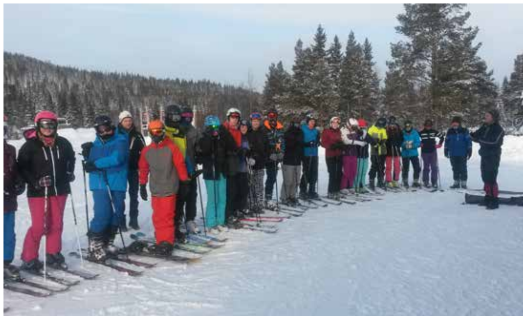
Alle samlet, klare for skikjøring.