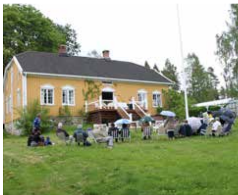
Aslakstrøm gård. Fra friluftsgudstjenesten i 2015

For mer info: Sissel M. Børke, 69199450/ SMB@halden.net