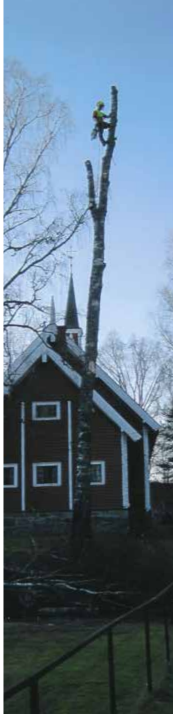
Trærne ble tatt ned bit for bit.