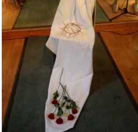
Kveldsgudstjeneste langfredag i Rødernes