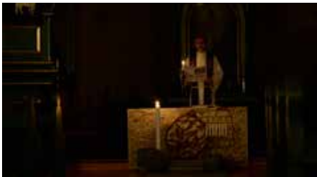
Påskelyset er tent, men kirken er mørk og graven er stengt.

Ute på kirkebakken sang vi: Deg være ære, Herre over dødens makt!