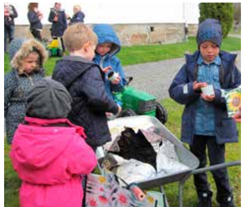
Etter gudstjenesten var det grilling og kaffe ute i et noe kjølig vårvær. De små traktorene med unge eiere var i farta, og det var mulig å så solsikkefrø.