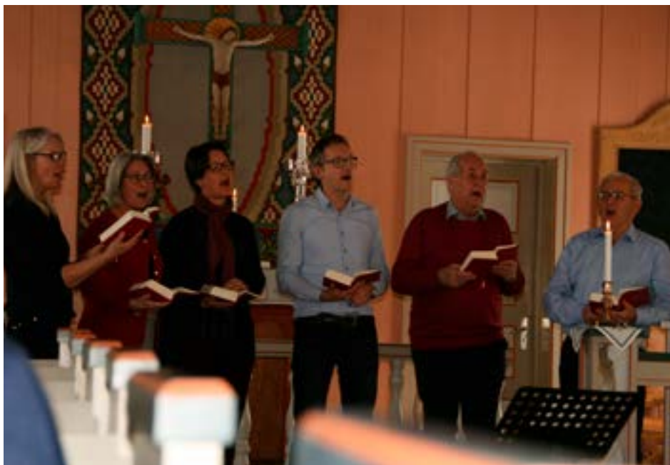
Kirkekoret er med under gudstjenesten