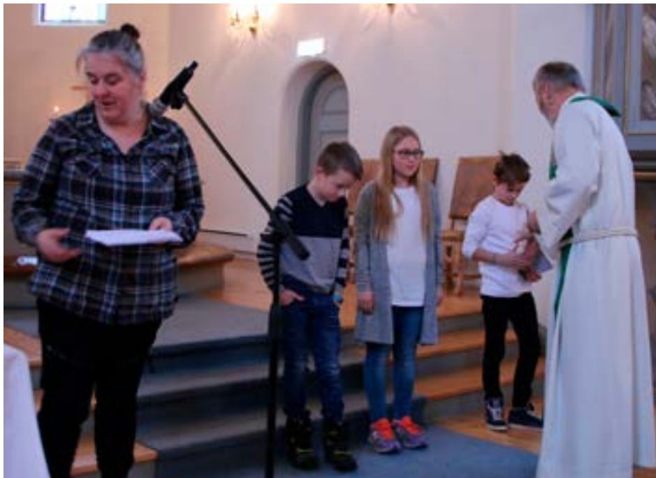
Femteklassingene fikk hver sin bibel