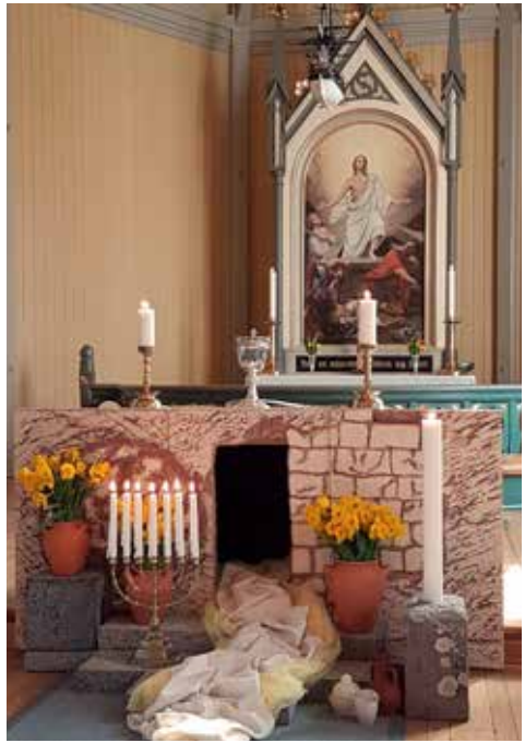
«Å, salige stund uten like, Han lever, han lever ennå!»