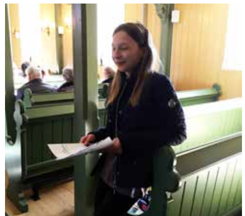
Konfirmanter i aksjon