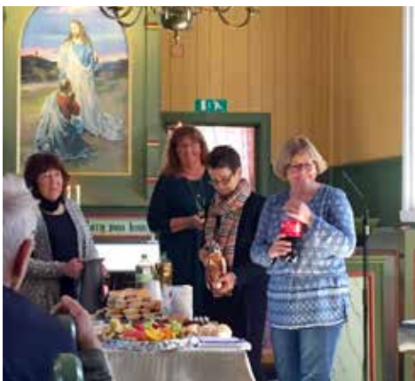
Årsmøte og kirkekaffe etter gudstjenesten