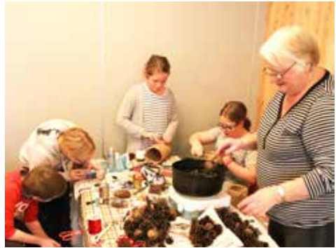
Her lages det tenbriketter for salg på misjonsmessa.

tekst: Solveig Bergstrøm, foto: Gunnar Ulsrød