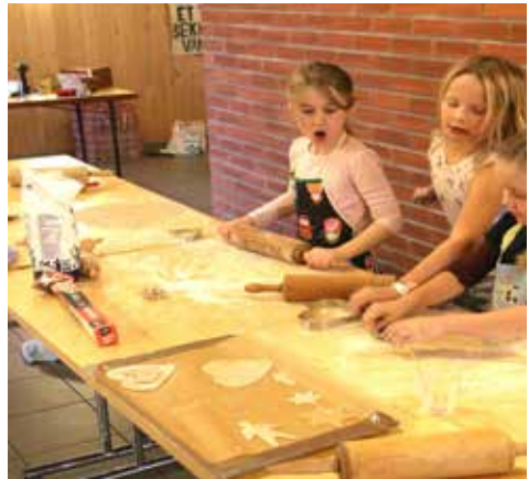
--- Det bakes pepperkaker