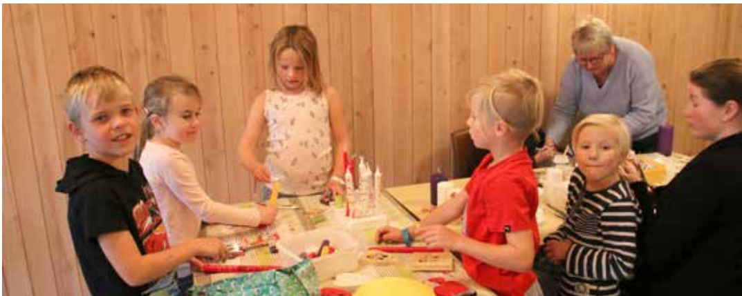
...og det pyntes lys.