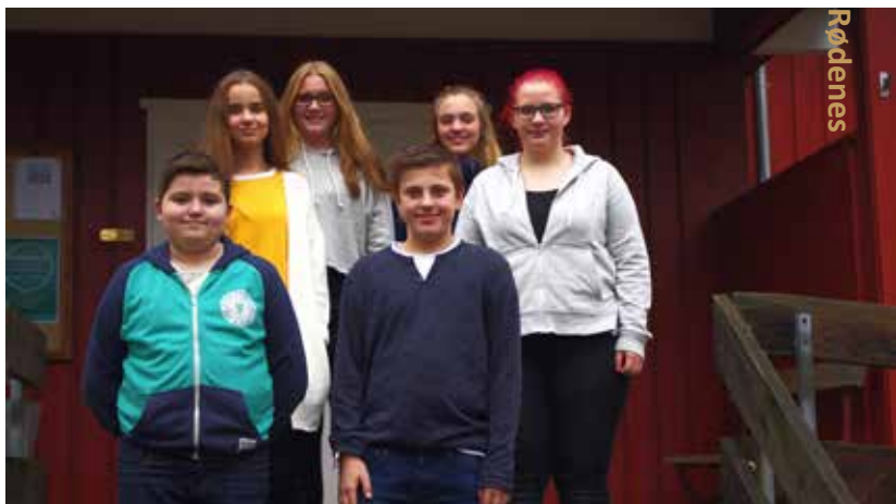
Fra første konfirmantsamling i Ørje kirke 25. oktober