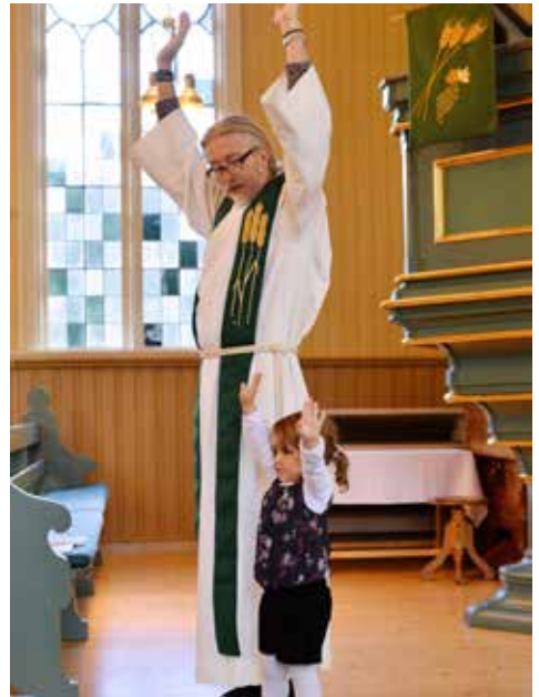
Hvem er størst?