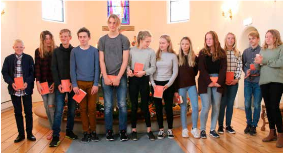
Neste års konfirmanter som startet med konfirmasjonsundervisning i høst.