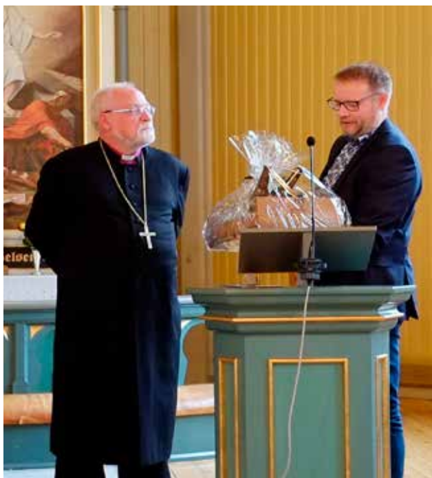
Under avskjed med biskopen overrakte kirkvergen en gave med kort-reist mat fra Matfatet.