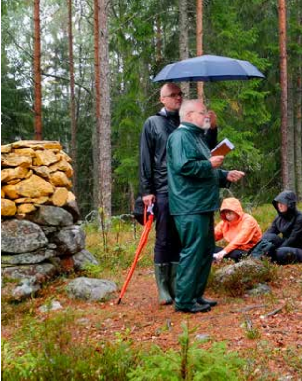
Biskopen fikk også hjelp til å holde papirene tørre.