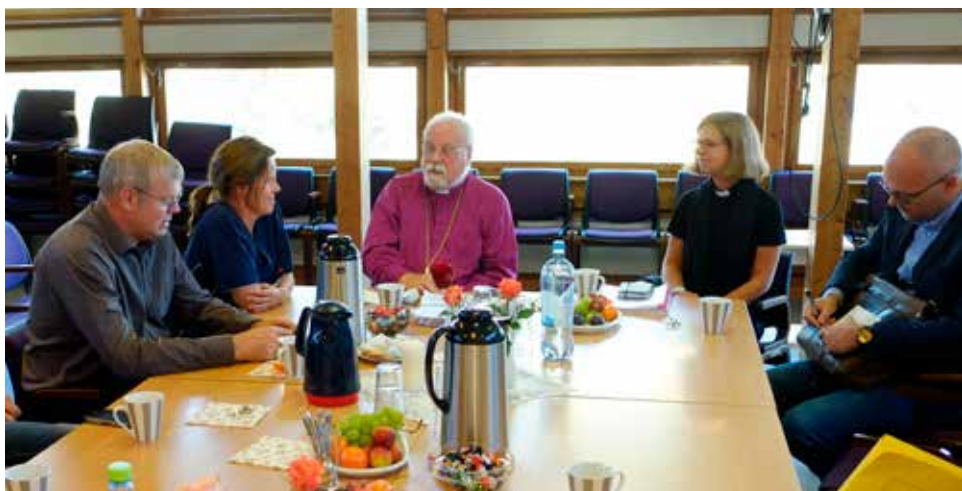
Fra møtet i Ørje kirke