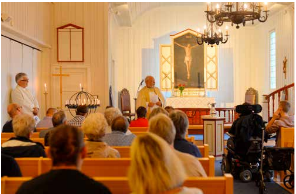
På klubbtreff 13. september; da kom den ekte biskopen. Her under hans hilsen til Klubben