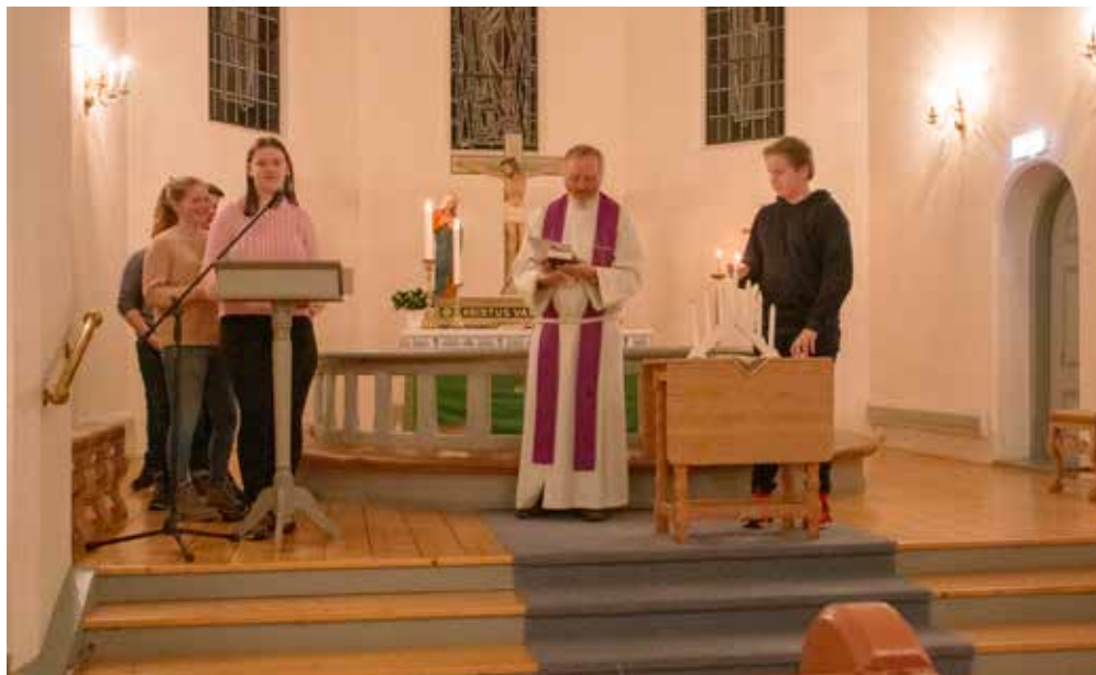
Konfirmantene deltok med tekstlesing og lyttening.