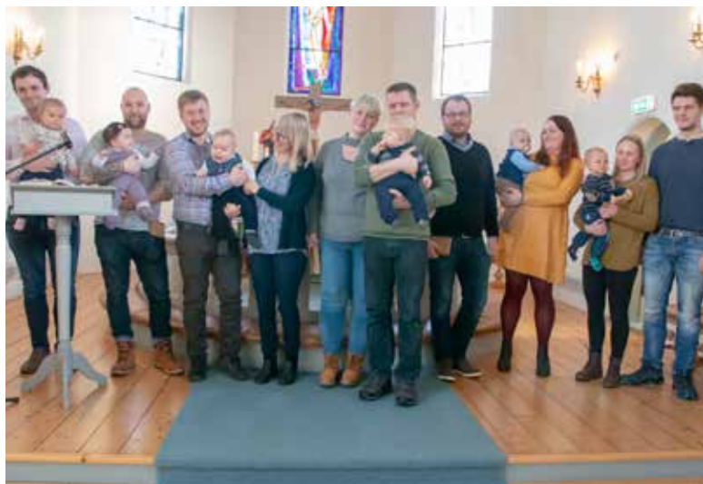
Fornøyde barn og foreldre

Søndag 3.februar var de 10 barna som ble døpt i 2018 invitert sammen med sine foreldre til gudstjenesten for å hente sin engel. Fra 2018 ønsker også Aremark å dele ut dåpsengler til alle som døper sine barn. En gang i året blir alle som har blitt døpt foregående år, invitert til en egen "hente-engelgudstjeneste". Utdelingen av en glassengel er også et fint symbol på Guds omsorg og nærvær for hvert enkelt barn.