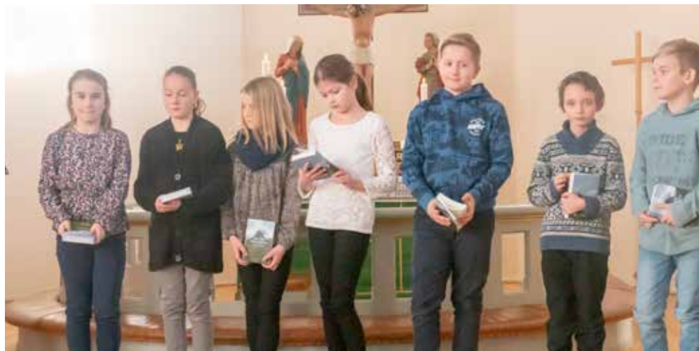
Her er 5. klassingene som mottok nytestamentet denne dagen.