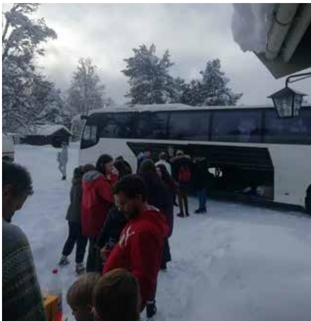
Her er vi klar på Livoll til hjemtur med buss søndag.