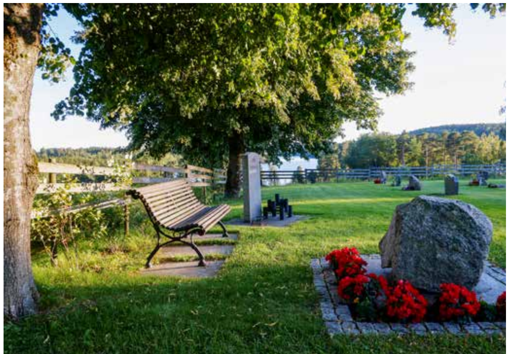
Øymark kirkegård og minnelund