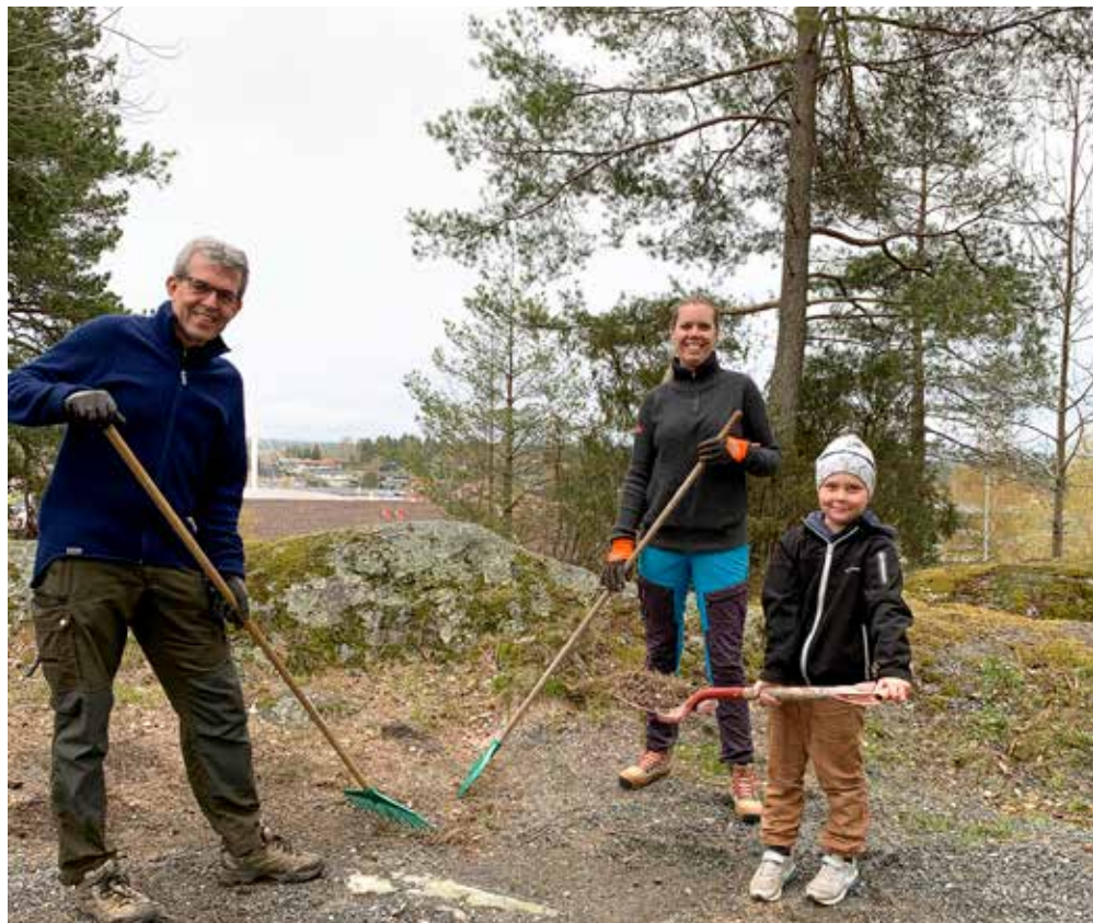
Dugnad ved Ørje kirke

sats utenfor kirken. Raking, rydding, klipping og bæring av kvist stod på programmet. Oppmøtet påfølgende tirsdag var noe lavere, men litt arbeid ble gjort da også. Takk alle for innsatsen! Mulig vi kaller inn til ny dyst når konfirmasjonen nærmer seg til høsten.