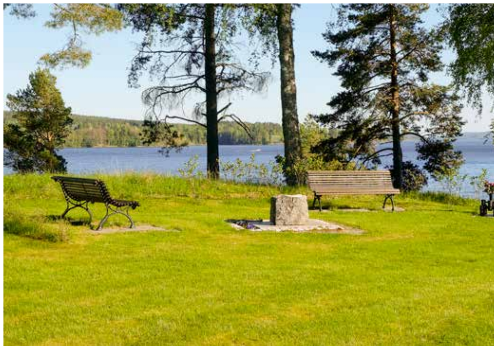
Rødene kirkegård og minnelund