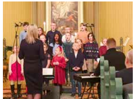
Barnekoret i aksjon under "Vi synger julen inn" i Øymark 2023