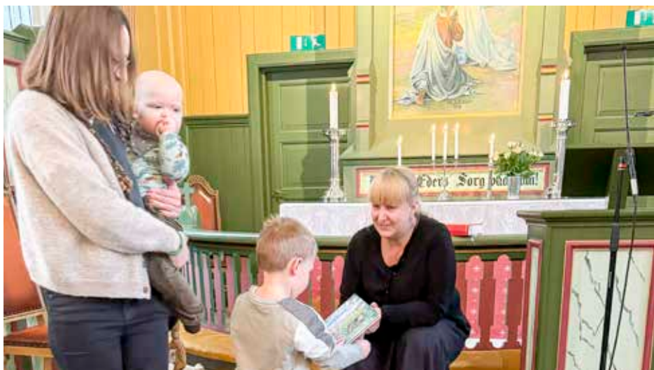
En av de frammøtte søsknene fikk også utdelt sin 4-årsbok litt forsinket; stas det også.