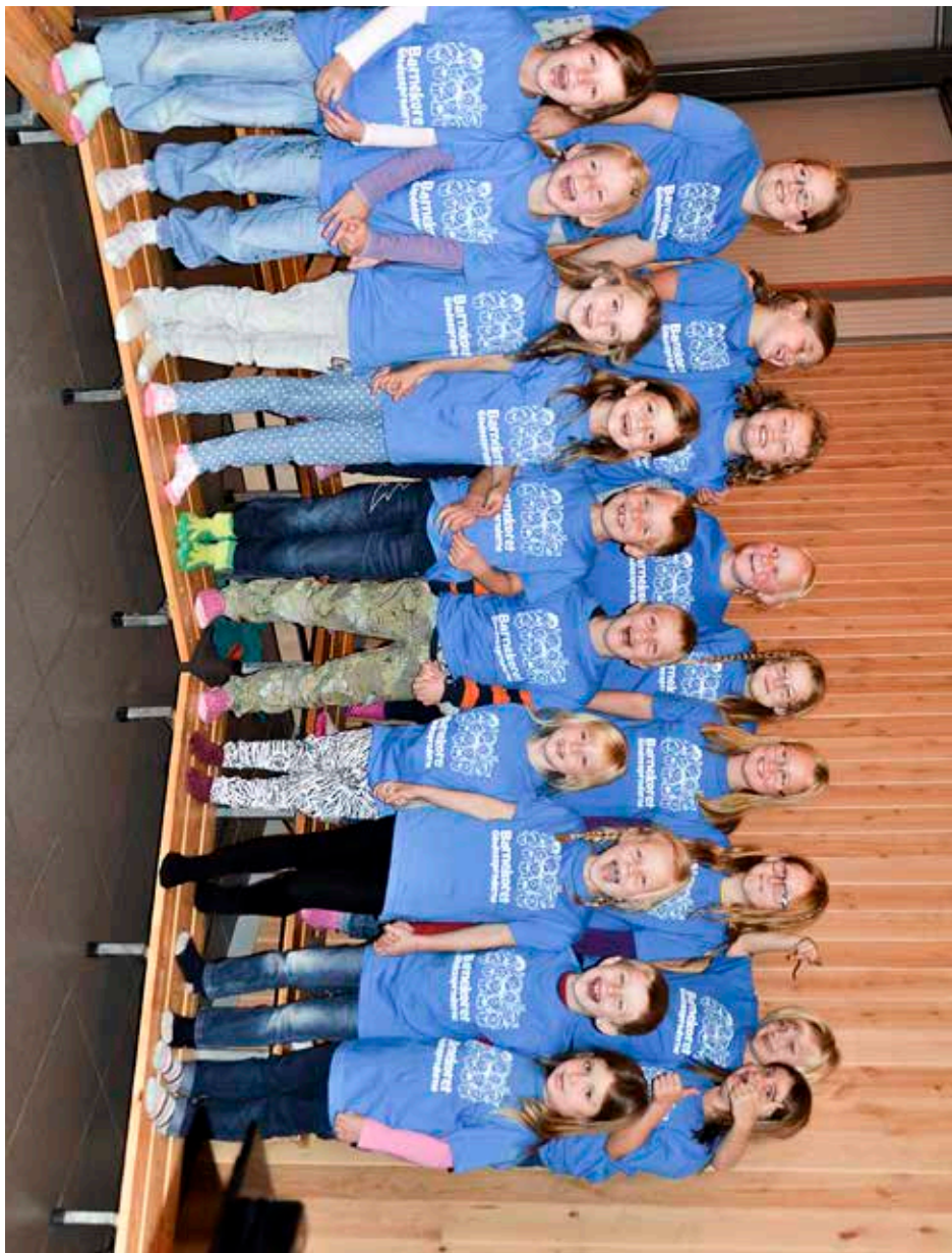
Barnekoret Gledessprederne i Aremark i 2014