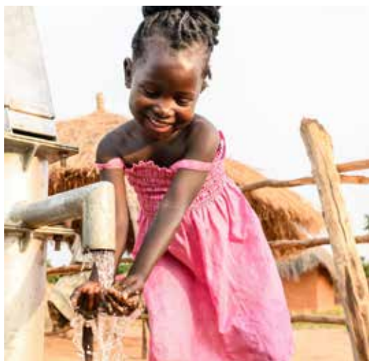
Champo (5 år) drikker rent vann fra vannpumpen i nærheten av hjemmet deres.

Akkurat nå gjør menigheter over hele Norge seg klare til å gjøre en forskjell. Til å forandre noe for andre. Det gjør vi gjennom å samle inn penger til Kirkens Nødhjelps fasteaksjon.