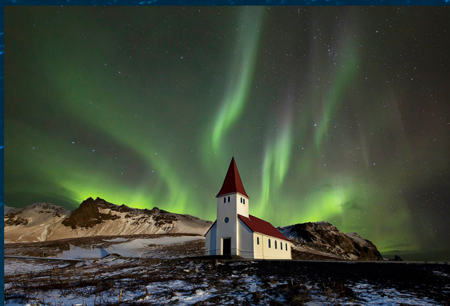
Det folket som går i mørkret, ser eit stort lys.

Bibelforteljingane i Det gamle testamentet vitnar om at Gud alltid har vore til stades i menneska si historie. Profetane som gjennom hundreåra minna folket om Gud sine handlingar med folket. Og som formidla håpet om Han som skulle kome - Underfull rådgjevar, Veldig Gud, Evig Far, Fredsfyrste.