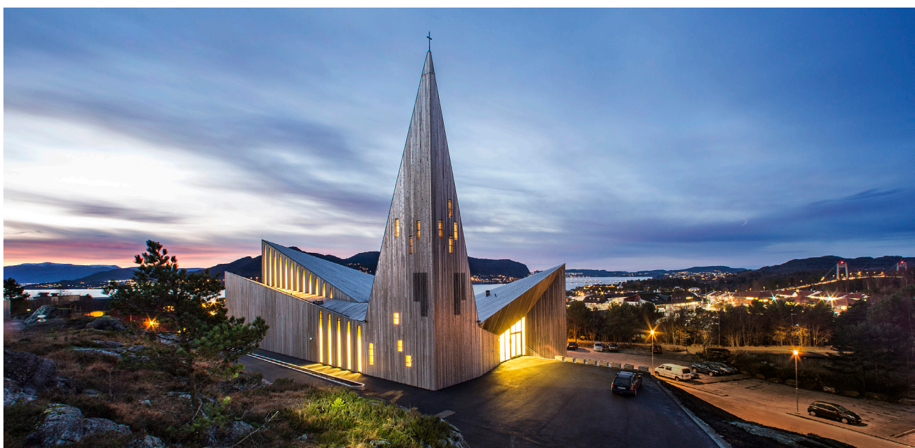
«-Som ei due som har funne sin stad»

Taranrød gler seg over at babysongen samlar mange små barn og foreldre. 2-3-åringane har kyrkjegym. Og når Knøttekoret møtast aular det med både barn og foreldre. Kyrkjeklubben er for menneske med psykiske utviklingshemming, og fredagsklubben samlar mange «twens». Bygdefolk og