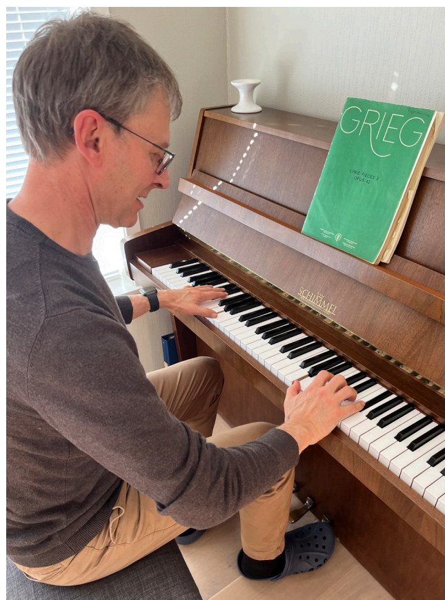
GRIEG: Eit kort parti frå eit av Griegs stykke avslører eminent teknikk og vakre tonar.

– Miljøvern engasjerer meg. Og så har eg reagert på at born