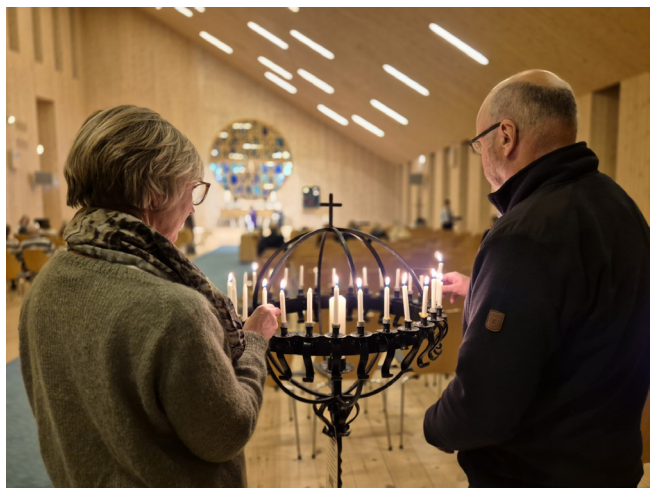
TENNER LYS: Den enkelte kan tenna lys i globen under bønnevandringa.