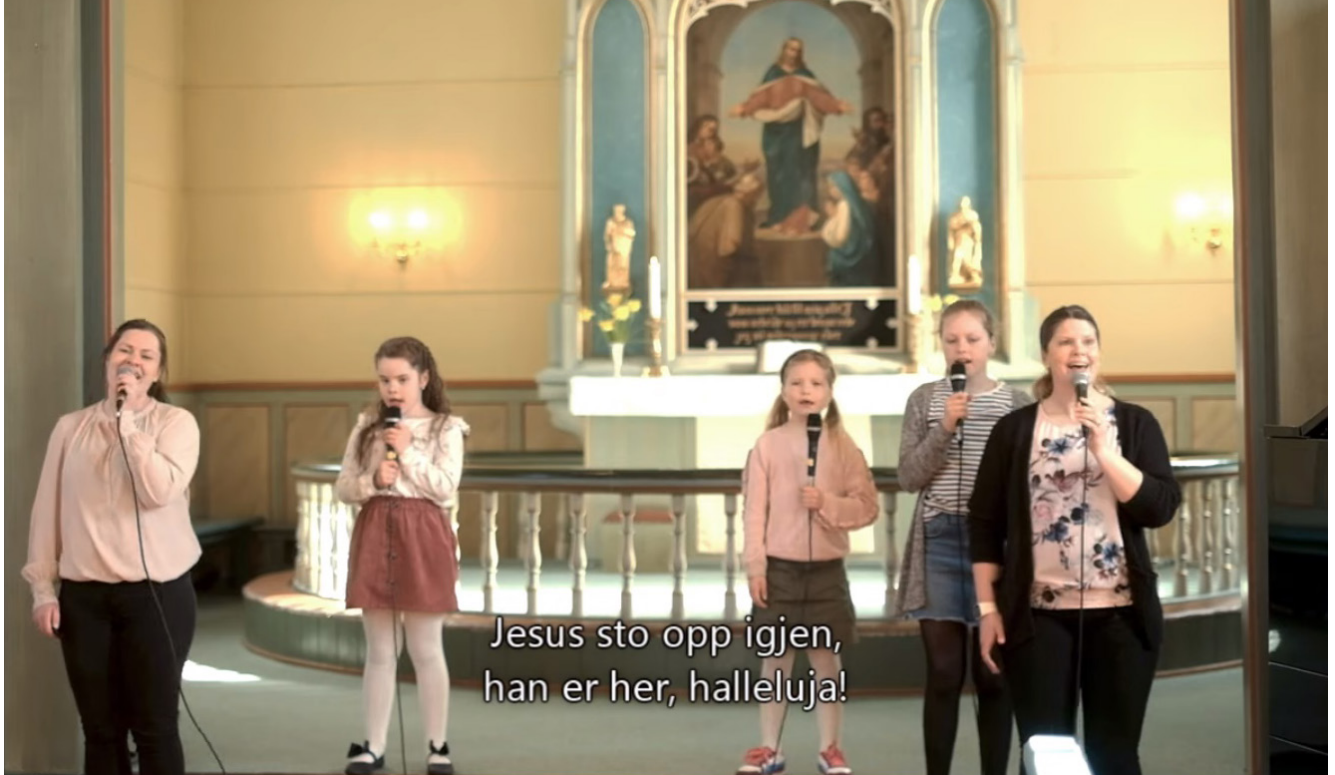
Skjermdump frå digital sending frå Meland kyrkjelyd.