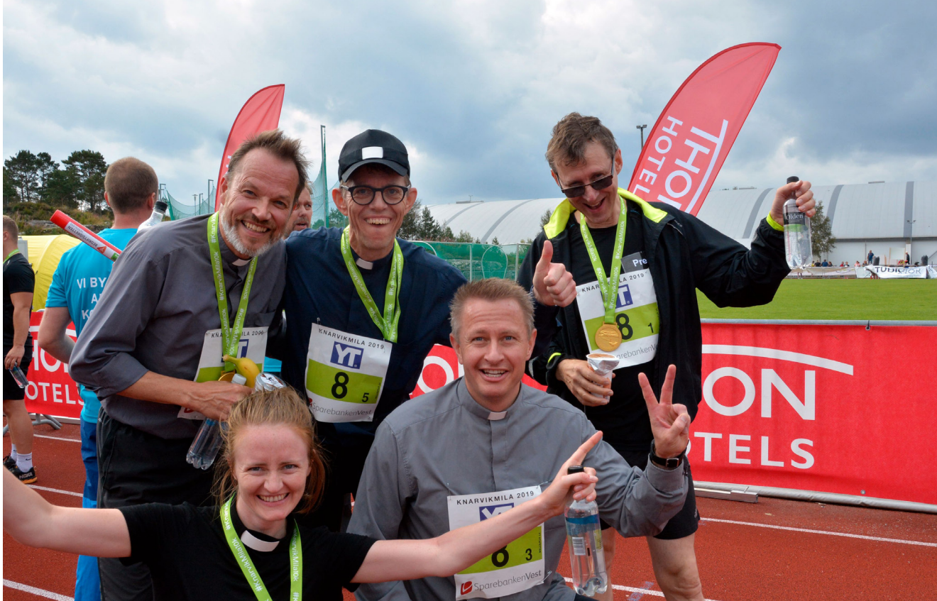
Prestane i Nordhordland viste igjen på Yt-stafetten i fjor.

i FN, Hilde Frafjord Johnson, som heldt eit engasjerande føredrag.