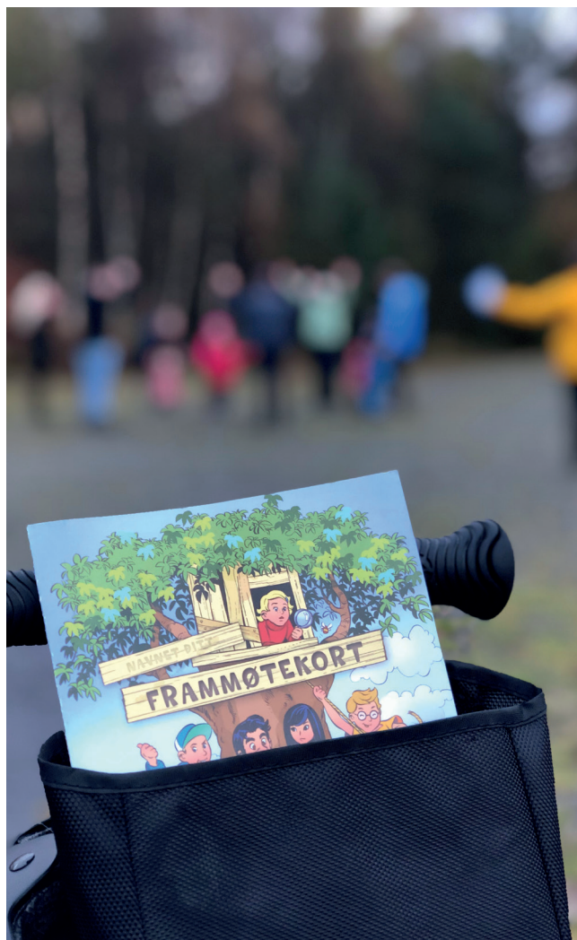
Stor stas å få klistremerke i Frammøtekortet! I bakgrunnen er leiken "Kongen befalar" i gong.