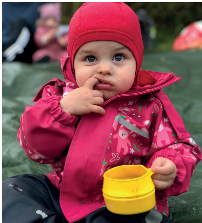
Godt med varm kakao i onsdagsklubben-koppen!