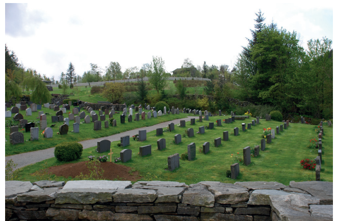
Ein velstelt kyrkjegard på Meland.