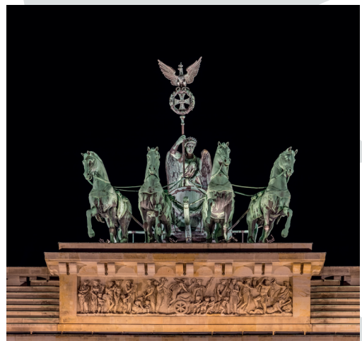
Hovudstaden i Tyskland.

Vinnar av kryssordet i nr 3/20: Kari Eidsnes, 5913 Eikangervåg.