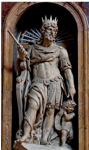
Nicolas Cordier. Statue av kong David i Basilica Santa Maria Maggiore, Roma.