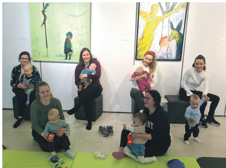
Mødre og born på småbarnstreff.

Sjølv om dei er takksame for gode stunder er alle samde om at dei lengtar etter eit meir ope samfunn. “Vi kjem snart!” seier dei til familie og andre kjente!