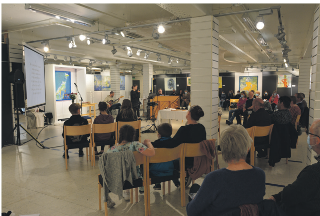
Litt av forsamlinga plassert med «korona-avstand».

Dei gamle sportsbutikk-lokala vart gjort om til kyrkje, der Anne Jakobsen sine vakre bilete pryda veggane.