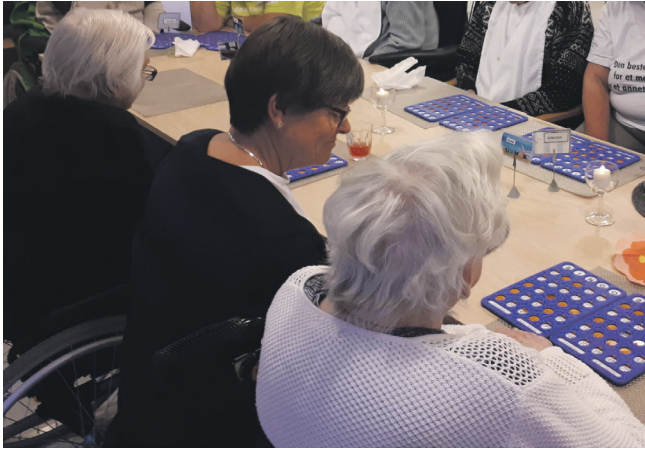
Besøksvenner på sjukeheimen.

Diakon Ruben smiler stort når han også fortel om besøkstenesta og kva som er hans rolle i samarbeidet: - Eg