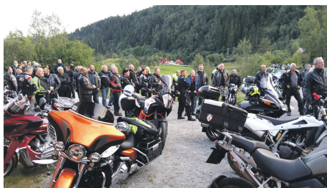
Mange MC-folk frå ulike klubbar valfartar til Holy Riders sine samlingar på Hjelmås.

– Vi er blitt kjende for ekstremt gode og sunne vaflar, seier HR-leiaren med eit smil. Klubben byr på gratis kaffi og HR-bibel (NT for MC-folk). MC-kafeen er open så lenge det ikkje er «kvite» vegar – eller korona-tiltak. Vinterstid held vi oss inne og dei fleste kjem då i bil. Men enkelte meiner ein MC-klubb er for dei på to hjul og køyrer MC.