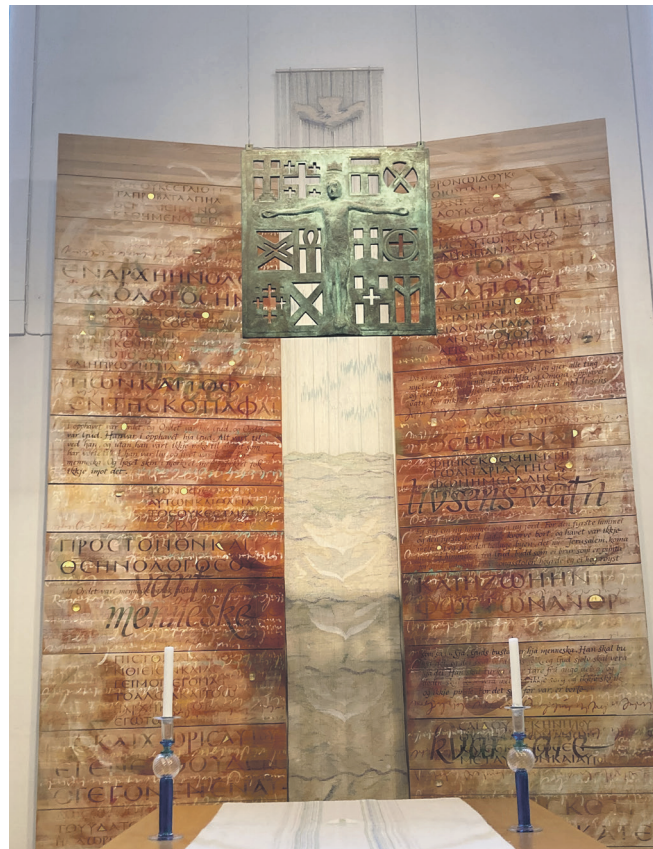
Fondveggen i Osteridet kyrkje.

(1 Kor 12,12-13) Mange kroppsdelar med ulike former og funksjonar, men likevel éin kropp – slik er kyrkja.