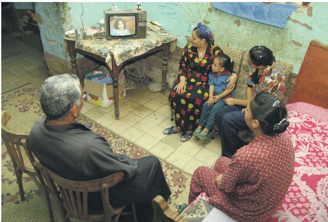
Familie i øvre Egypt ser på TV.