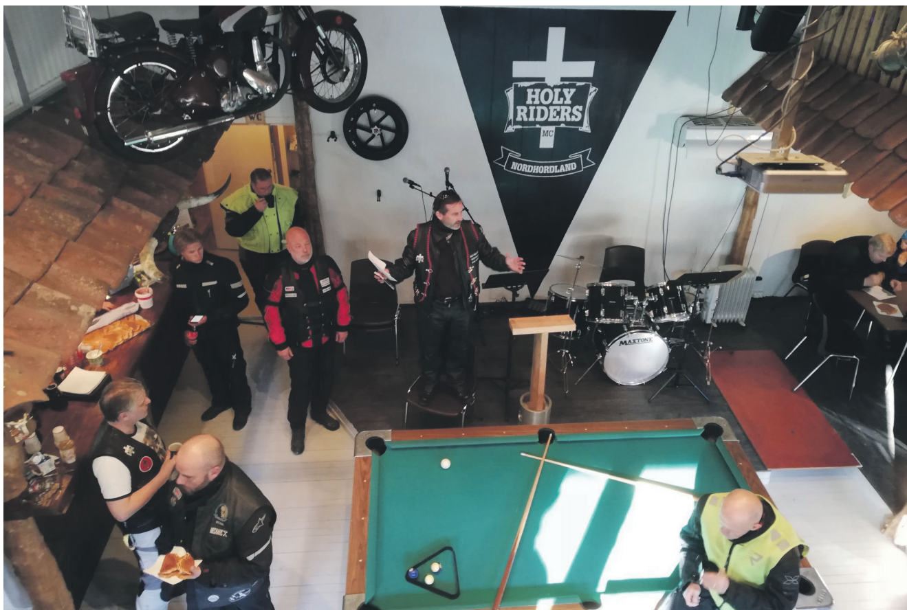
Det nedlagde bedehuset i Sandvikadalen på Hjelmås har fått nytt liv som klubblokale for MC-klubben Holy Riders.