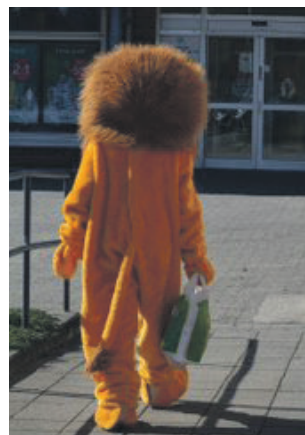
Borna og løva går til løvegjengen på Møteplassen.