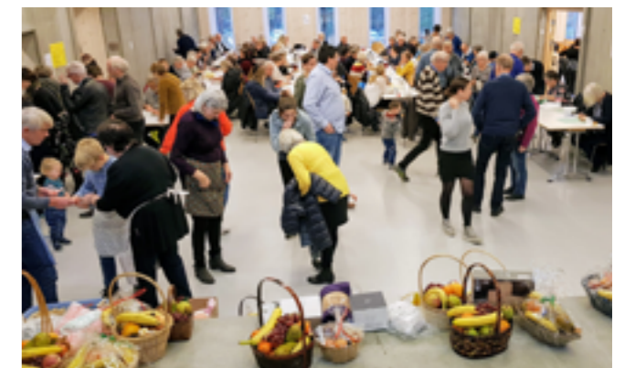
Frå misjonsmessa i Knarvik kyrkje for NMS i 2018

Under sjølve messa er salsdiskane veldig populære. Det går unna av det som vert lagt fram. Lettast å selje er gjerne matvarer, kaker, lefser, julebakst, hermetisert frukt og andre varer av liknande slag. Massevis av handarbeid vert selt unna. Kunstverk kan byte eigar til prisar på fleirfaldige tusenlappar.