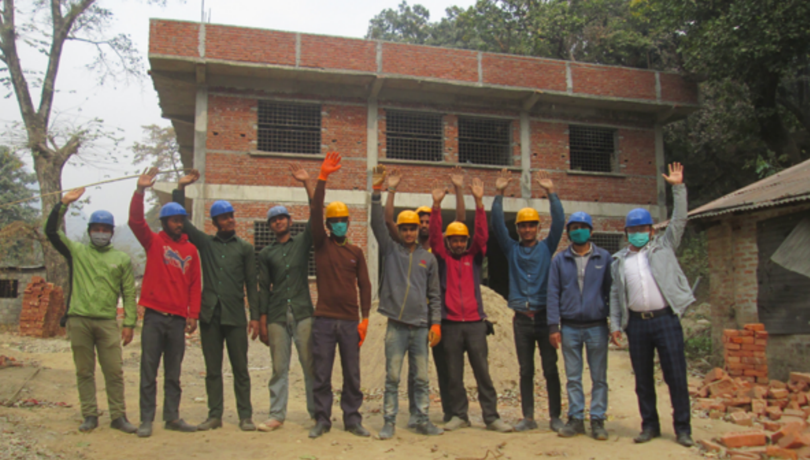
Byggegjeng framfor skolebygg for byggfag.