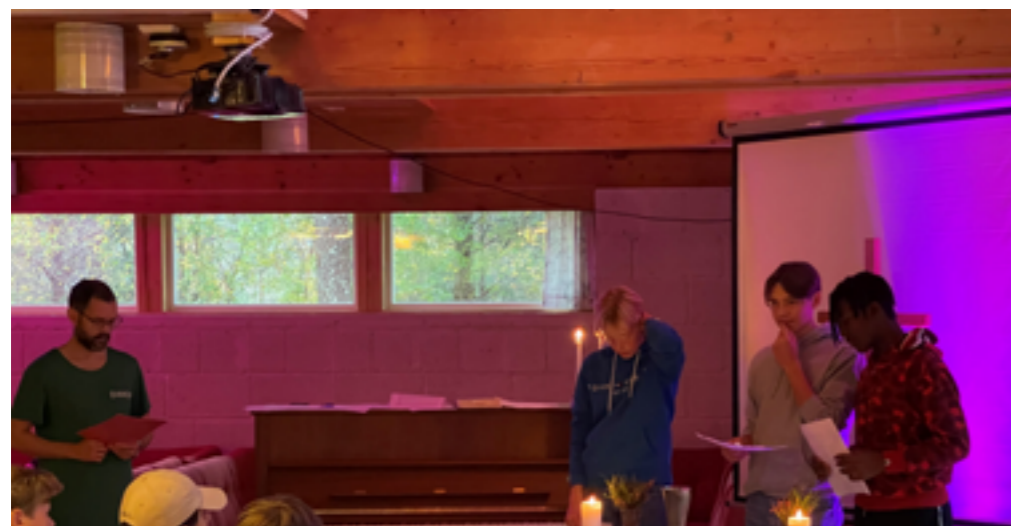
Leik høyrer med på leir.