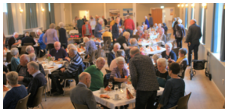
Seniors 'S i festsalen på Nordhordland folkehøgskule.