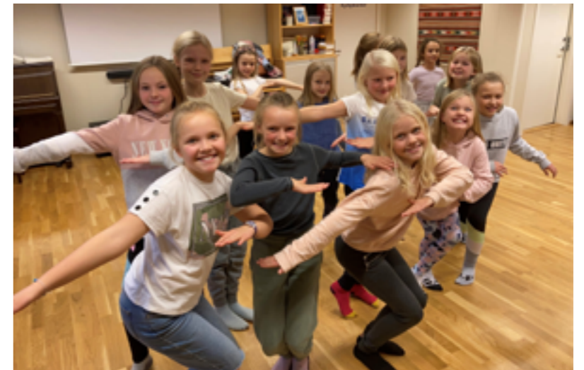
Frå dansetrening på Møteplassen, Frekhaug.