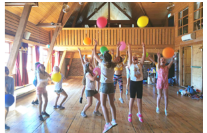
Frå dansetrening i mai 2021.