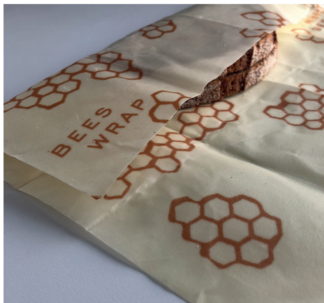
Skivene til lunsjen både ser bra ut og smakar godt i bivokspapir

FOR FLEIRE AV MINE KVARDAGSVANAR: SJÅ @INGVILDDALHUS PÅ INSTAGRAM