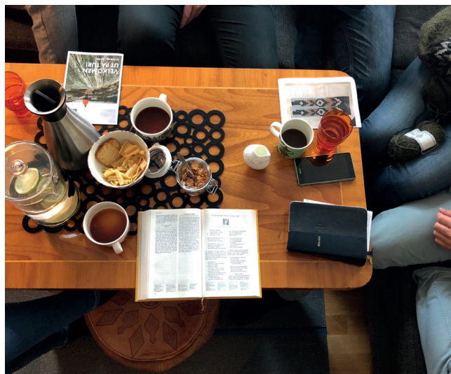
Bestemor sitt spisebord kjem godt med når husgruppa er på besøk