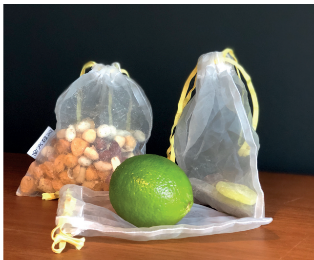
Lausvektspisar til handling og oppbevaring