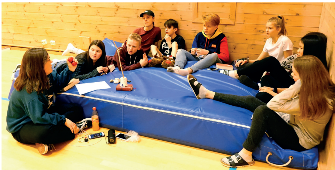
Konfir- mantane deltok aktivt i sporløp om gudstenesta og om Kristuskransen

11.-13. januar var konfir- mantane på leir på Fjell-ly på Sotra. Vi hadde fine dagar saman med lek og moro, undervisning om gudste- nesta og Kristuskransen, og fine samlingar med bøn, song og nattverd. Ein spor- ty gjeng tok seg til og med eit bad i fjorden! Her er nokre glimt frå ei fin konfir- manthelg!