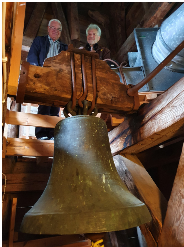
Intervjuet blei gjort i kyrkjetårnet i Alversund kyrkje.