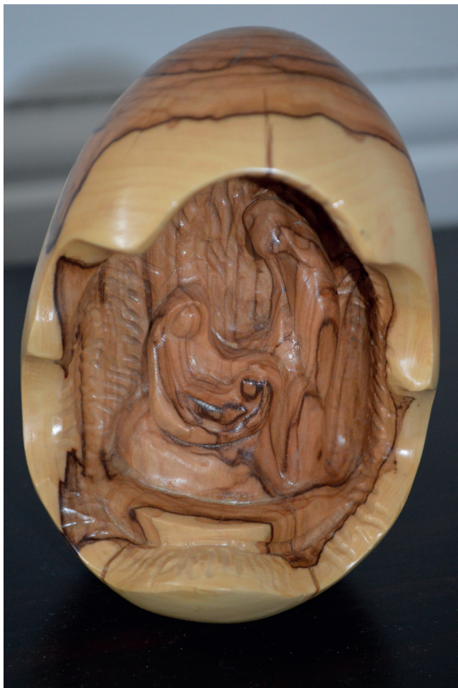
Lita julekrubbe frå Israel