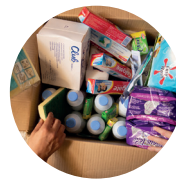
HYGIENEPAKKE kr 250