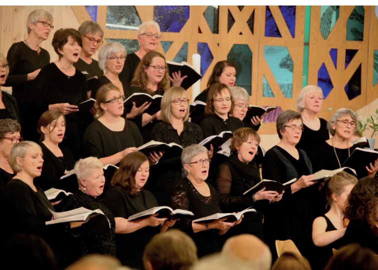
I fleire år har koret veksla mellom Händels Messias og Bachs Juleoratorium.