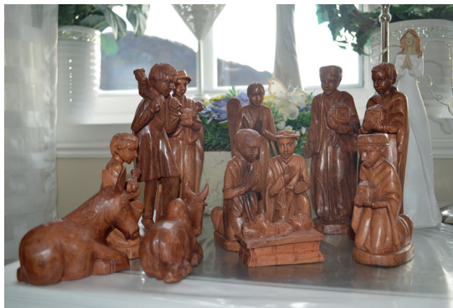
Julekrubbe frå Madagaskar