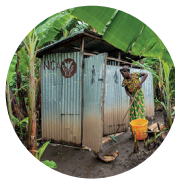
DO kr 120