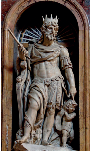
Nicolas Cordier. Statue av kong David i Basilica Santa Maria Maggiore, Roma.