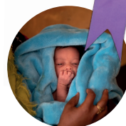
EN GOD START kr 300