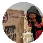
RENT VANN kr 250