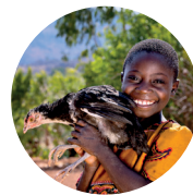
KYLINGER kr 100

Du finner disse og flere gaver i vår nettbutikk www.gaversomforandrerverden.no