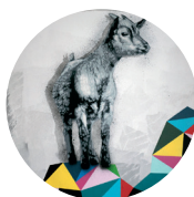
GEIT kr 250

Gaver for alle anledninger! Velg noe fra vår nettbutikk som passer mottakeren av gavekortet og ditt gavebudsjett. Inntektene skaper forandring for mennesker i nød!