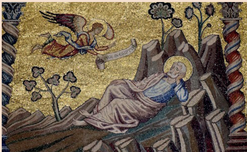
Josefs draum. Mosaikk i dåpskyrkja i Firenze. Maestro della Maddalena. 1300-talet.