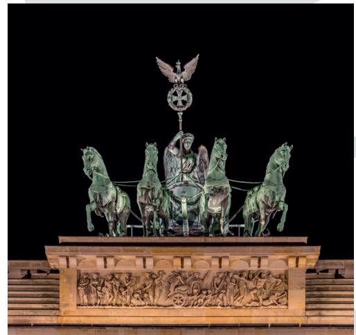
Hovudstaden i Tyskland.

Vinnar av kryssordet i nr 3/20: Kari Eidsnes, 5913 Eikangervåg.