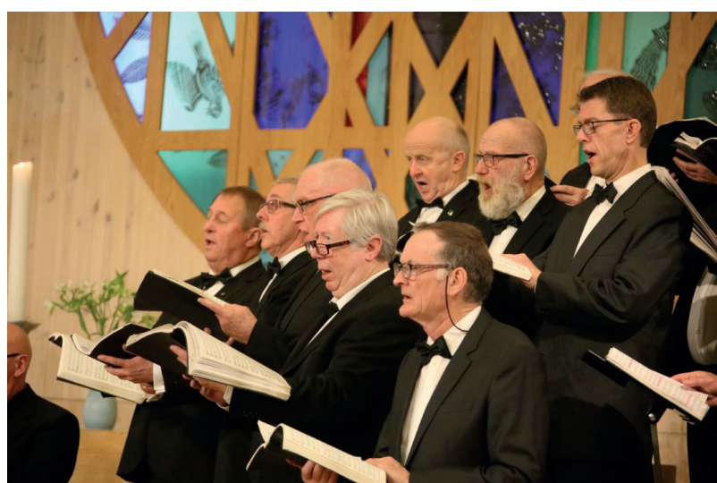
Frå julekonsert i Knarvik kyrkje.