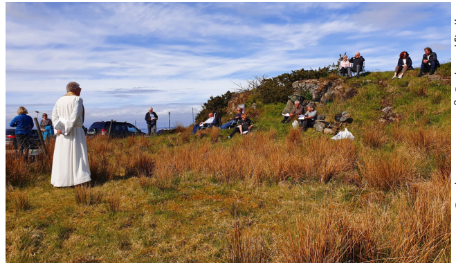
Gudsteneste på Solendfjellet

«Kyrkja må stadig minne om at vi er kalla til å vise den same omsorga for jorda som Gud har vist oss gjennom den finstemte samanhengen i skaparverket. Kampen for klimarettferd er ein del av oppdraget Jesus Kristus kallar oss til». Bispemøtet, 2021.