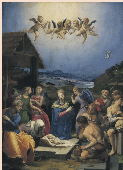
«Hyrdane som tilber». Agnolo Bronzino. 1502-1572

Takk for meg! Det har vore ei festreise å vera biskop i Bjørgvin. Eg ønskjer dykk alle ei gledeleg jul og Guds velsigning!