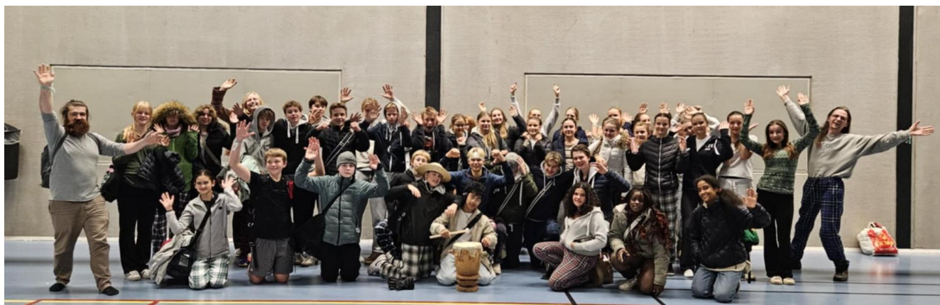
D41 på pysjcup

D41 prøver etter beste evne å holde seg grønn. Vi tar kollektiv til arrangementer utenfor Ås og lager samkjøring når det er behov for det. Teknikklageret til D41 ble oppgradert for bedre tilgang, men plankene ble gjenbrukt fra materiell funnet på lageret. D41 streber også til å unngå matsvinn ved å gi bort maten som er til overs etter kveldene.