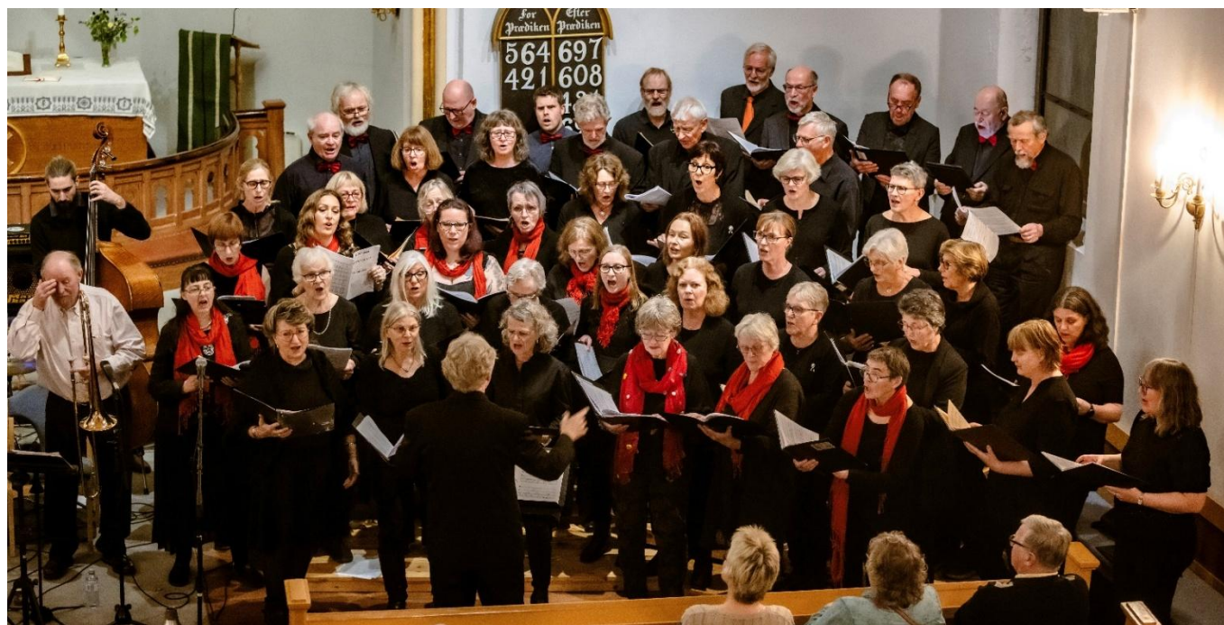
Lionskonsert sammen med koret SkiMix og Magnolia Jazzband