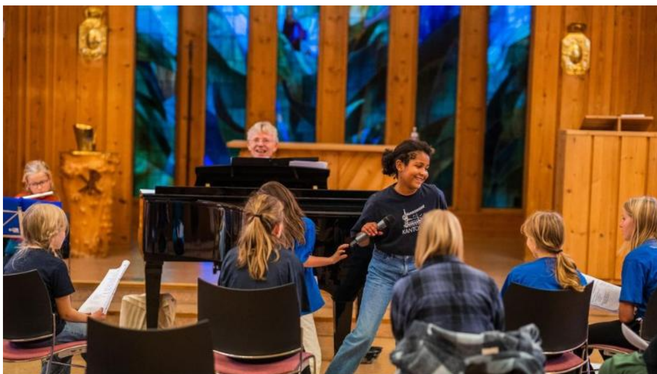
Den norske kirkes kulturaktivitet verdiskaper 1 milliard kroner. Illustrasjonsfoto fra korøvelse i Ås kirke.

I november 2024 kom det en ny rapport som forteller at Den norske kirkes arbeid innen kultur og kulturarv bidrar med verdiskaping på 4,3 milliarder kroner. Årlig verdiskaping er 1 milliard kroner fra kulturaktivitetene i kirken. Jeg er sikker på at vi ved vår virksomhet i Ås menighet er med på å skape viktige verdier – også økonomiske: Vi samarbeider med kommune, kulturskole, vi engasjerer barn, unge og profesjonelle musikere til våre større eller mindre prosjekter. Her er illustrasjonen til rapporten: