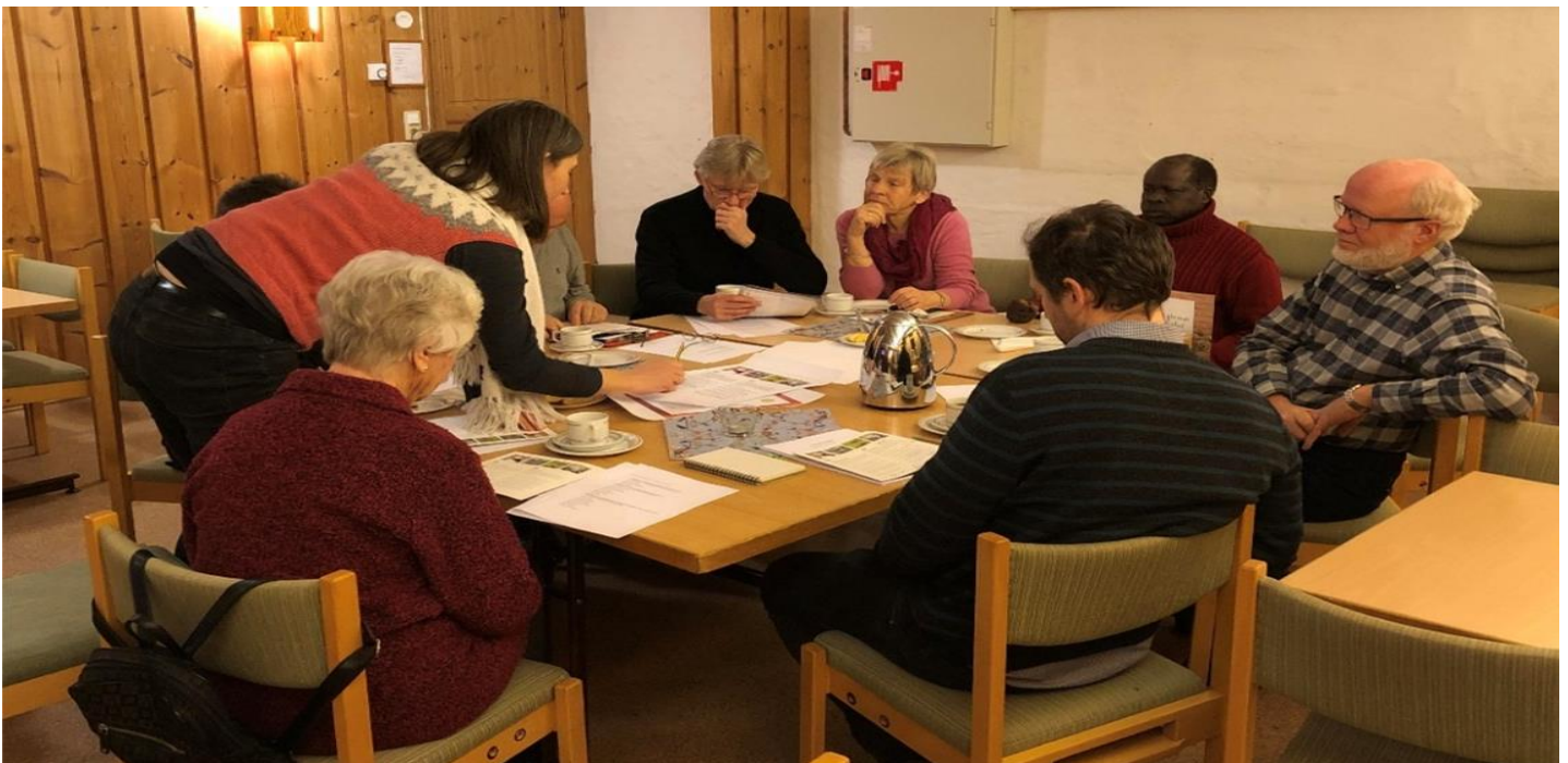
En arbeidsgruppe i dyp konsentrasjon!

Grønne menigheter er etablert over hele landet etter initiativ på nasjonalt nivå rundt århundreskiftet og hvor klima og miljø har overordnet fokus. Rollen til Grønt utvalg er å være en «ansvarsgruppe» som dels initierer egne tiltak og dels gjennom dialog bidrar til grønn profil innen gudstjenestelivet, trosopplæring, diakoni og forvaltning av materielle ressurser. Kopling mot lokalsamfunnet er et viktig aspekt. Merk: Rapportering fra de sistnevnte områdene finnes under de respektive kapitler andre steder i årsmeldingen.