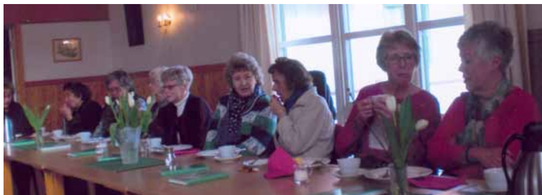
Fra langbordet under formiddagsmaten etter kirketreffet i Nordby kirke 5. mars.