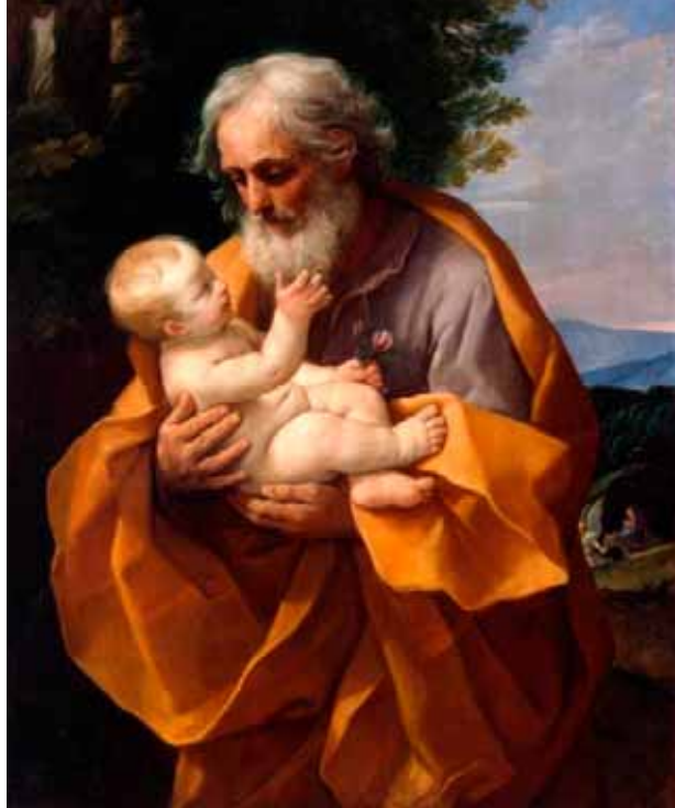
St. Josef med Jesusbarnet av Guido Reni (1575–1642). Bildet er malt ca. 1620. Nå henger det i det statlige Ermitazj-muséet i St. Petersburg, Russland.