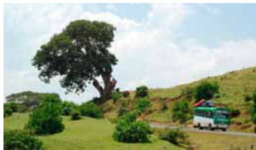
Deltagerne på Team Etiopia og Team Madagaskar skal få oppleve afrikansk landsbygd.