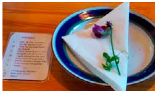
Frokostserviett på Tomasgården.

Jeg vender gjerne tilbake. Tomasgården er et godt sted. Tre dager trengs for å roe ned.