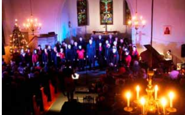
ÅsEnsemblet i Ås kirke.