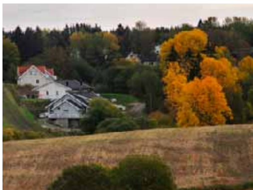
Løsning på forrige oppgave: Bildet er fra Vollholen i Kroer, husnummer 23.