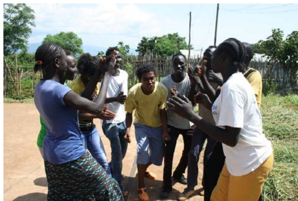
Mao-folket har ikke lov å vise fram sin kultur.

Det ble drukket mye kaffe på turen. Den var laget på det billige skallet i stedet for bønnene. Turen bekreftet igjen at NMS sin satsing på minoriteter og marginaliserte grupper er viktig. En bibeloversettelse til et språk som ikke er anerkjent, og som foreløpig få kan lese eller skrive, ligger nok ganske langt fram i tiden. Det er viktig at vi bryr oss og ikke mister målet om Guds ord på morsmålet ut av syne!