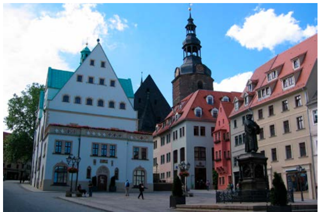
Eisleben, der Luther ble født og døde. I bakgrunnen: St Andreaskirche.