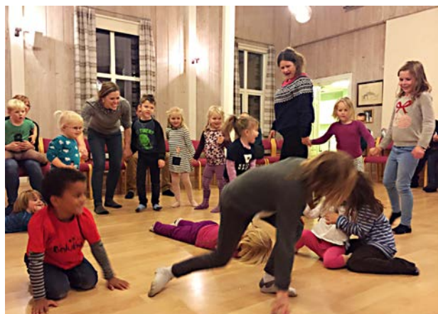
Full fart med «Bjørnen sover».

Baluba-koret har over 30 medlemmer, men vi er ikke alltid 30 på øvelsene. Det er såpass uhyttelig at man kan komme når alt klaffer. Er barna for slitne etter barnehagen, går det greit å stå over en Baluba-øvelse. Medlemskontingenten er på kr 50. Da får barnet også en Baluba-T-skjorte. Den er fin å ha på når koret opptrer.