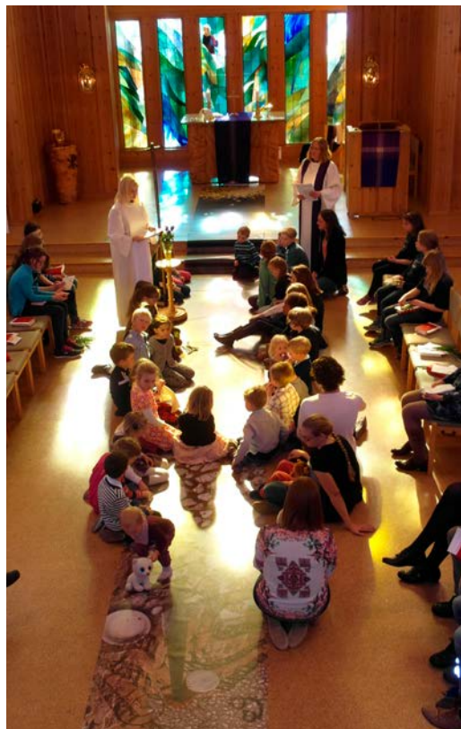
Påskevandring i 2016.