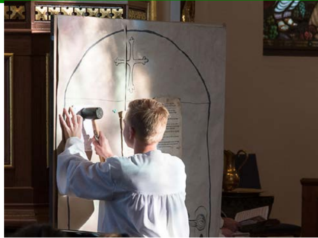
En konfirmant hamrer opp moderne teser i Ås kirke.