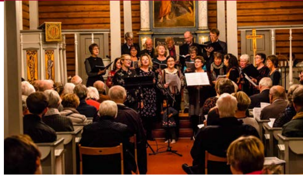
KroerAdHoc foran fullsatt Kroer kirke under «Salmer gjennom 50 år» 03.11. i fjor.