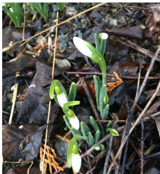
Snøkløkke, i år forbereder hagen påskeblomstene tidlig.