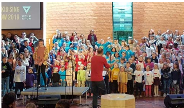
Kid Sing-show i Holmlia kirke.