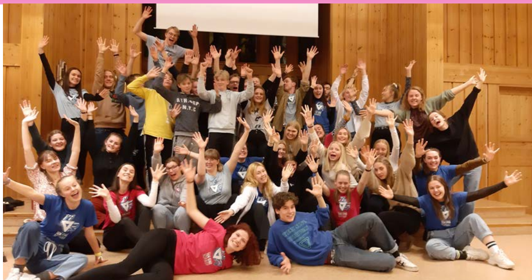
Ås-ungdommen med besøk fra Ten Sing Norway fredag 28.02.