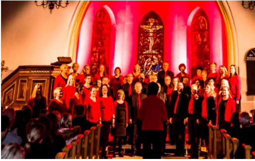
Fra konserten i 2017.