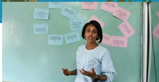
Fredsworkshop i Lideta der viktige punkt settes på lapper på tavla.

Representanter fra fredskontoret og Sophie samarbeidet om innholdet på workshopen. Dagen begynte med å snakke om hva som er fred og hva som er konflikt. Hva er egentlig «vold»? Ofte forbindes vold med fysisk utøvelse av vold, men vold kan også være psykisk, strukturell