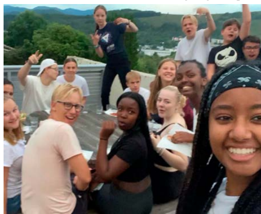
Stemmingsbilde fra Ten Sing seminar.

Ingrid Ulvestad Øygard, barne- og ungdomsprest