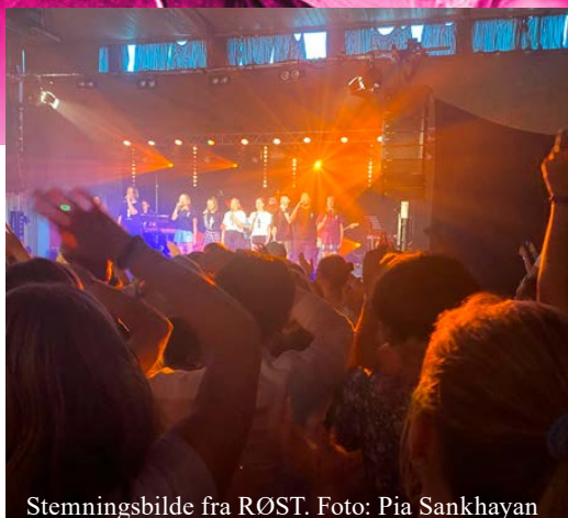
Stemmingsbilde fra RØST.