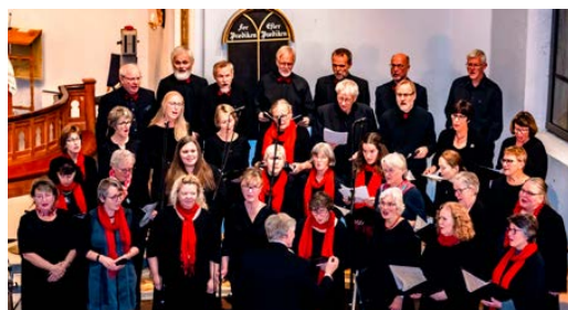
Ås kirkekor og Skimix.