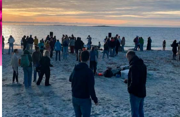
Ten Sing seminar.

Annethvert år arrangerer KFUK-KFUM Norge og KFUM-KFUK Danmark RØST-festivalen og Wonderful Days. Neste år er det altså Danmark sin tur, og ryktene tilsier at ungdommene er gira på å sette kursen sørover for mer festivalstemning!