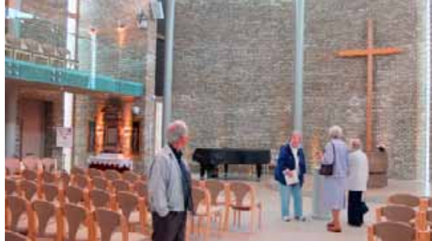
Kirkerommet i Vestfossen kirke, t.v. altertavle i alabaster fra 1375. Alteret er kvernsteiner fra Vestfossen Cellulose