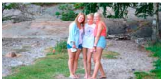
Bilder fra konfirmantleiren på Tjellholmen leirsted.