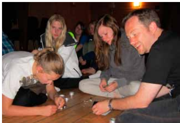
Fra konfirmantleiren 2012.