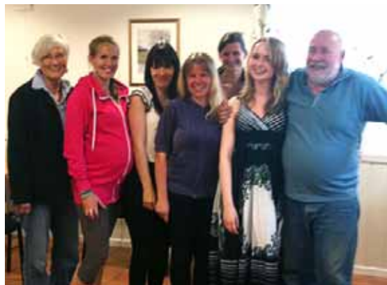
Korgruppa fra Nordby menighet, FAM-koret.