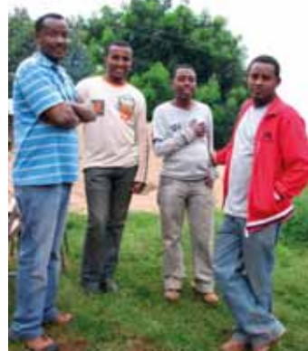
Lokale prosjektledere i Wollega.