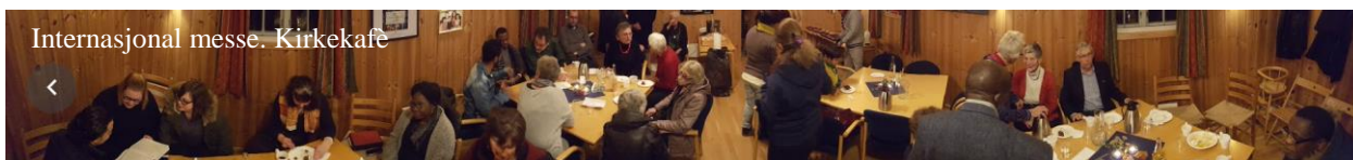
Internasjonal messe. Kirkekafe