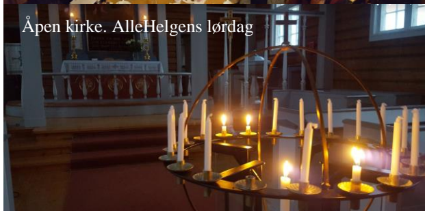
Åpen kirke. AlleHelgens lørdag