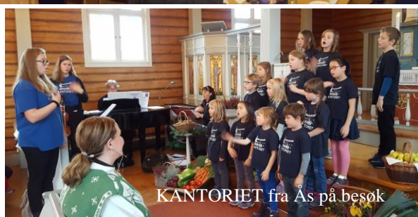
KANTORIET fra Ås på besøk