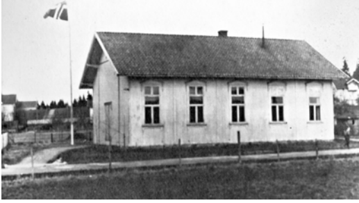
Cirka 1910. De store, originale vinduene gikk nesten helt opp til gesimsen.

Da sentrumsplanen for Ås ble vedtatt i 2019, ble den kulturhistoriske verdien til Ås menighetshus oversett. Området ble regulert til fornyelse og fortetting. Plutselig var framtida til det historiske forsamlingslokalet høyst usikker. Pengesterke utbyggere begynte å banke på døra. Heldigvis våknet kommunestyret i tide. I 2021 ble det vedtatt at bygningen skal inngå i hensynsone for bevaring av kulturmiljø. Dermed er framtida sikret for det unike forsamlingslokalet med kulturhistorisk sus.