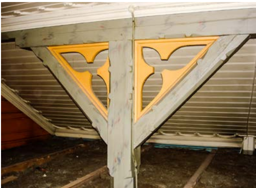
Den gamle himlingen er fortsatt intakt over inner-taket som ble senket på 1950-tallet.