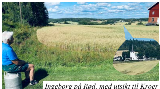
Ingeborg på Røed, med utsikt til Kroer kirke.