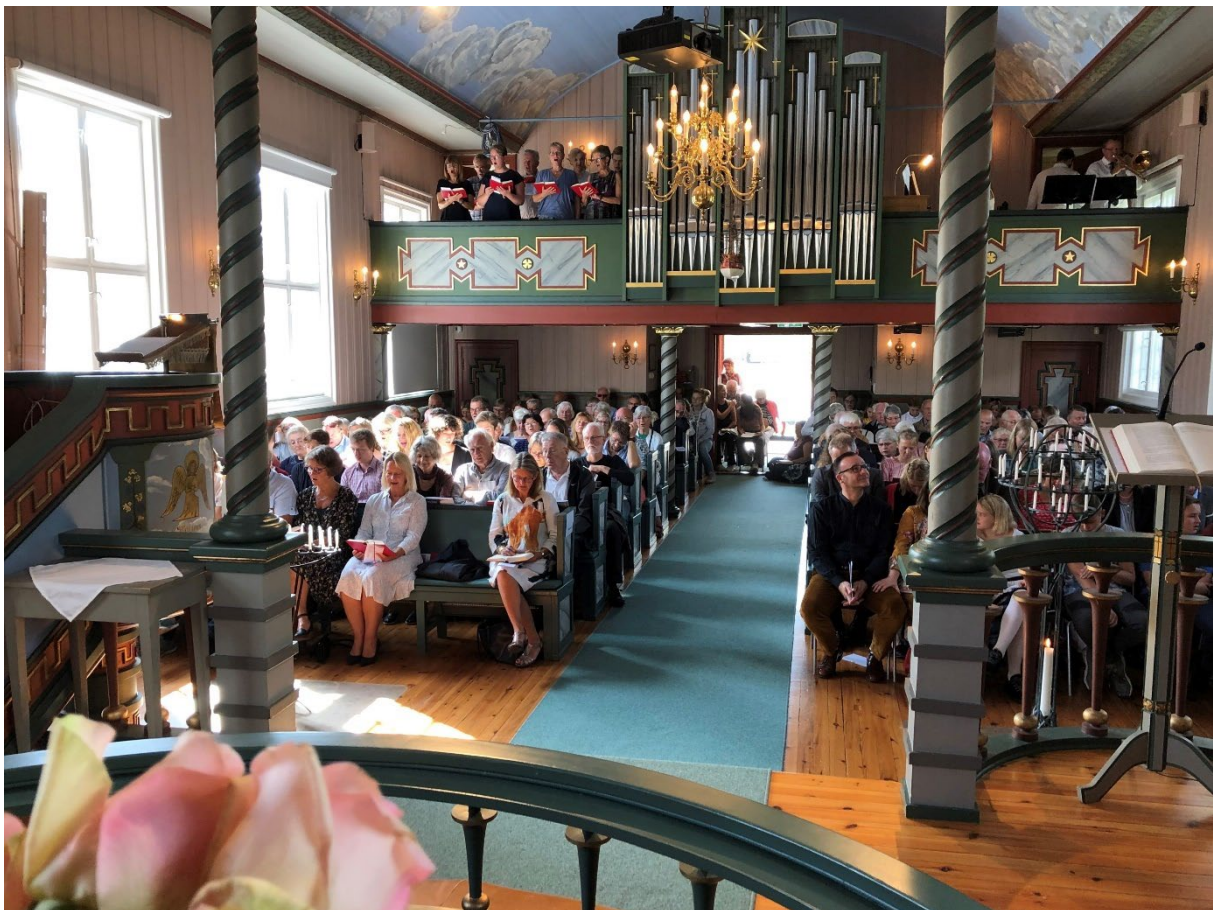
Gudstjeneste i Heggedal kirke.

For Asker sokn gjenstår fortsatt noen formaliteter før ny grunneiendom blir formelt opprettet.