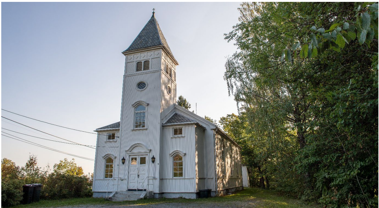
Nærsnes kirke har lite hensiktsmessige toaletter. Etter planen vil kirken i 2024 få universelt utformet toalett i eget sidebygg.