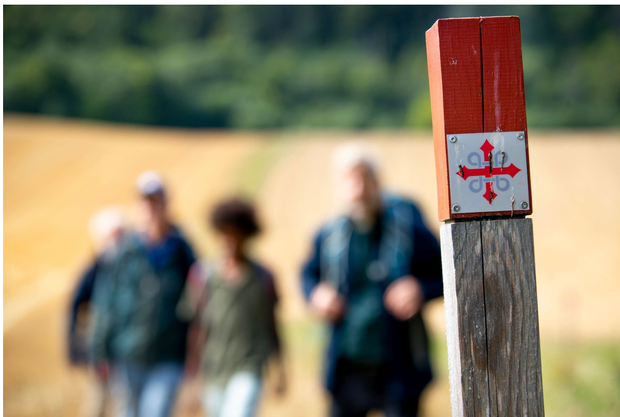
Tunsberg-leden går gjennom Asker.

Flere av menighetene i Asker prosti er med i Pilegrimforeningen St.Hallvard av Huseby og tilknyttet Regionalt Pilegrimssenter Oslo. Det ble i 2022 arrangert vandringslederkurs over fire lørdager med deltakere fra vårt område. Pilegrimsleden gjennom Asker er delvis nymerket i 2022. Dette er et samarbeid mellom Asker kommune, Viken fylkeskommune, frivillige og Pilegrimssenter Oslo.