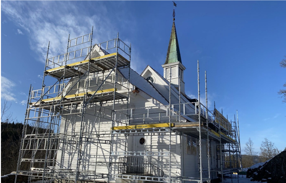
Kongsdelene kirke har i 2022 fått nytt utvendig tak, takrenner og nedløp.