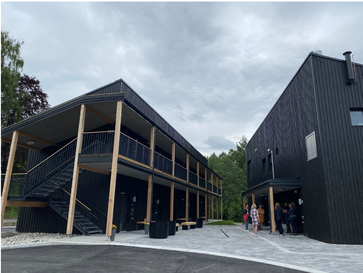
I 2022 ferdigstilte Asker kommune nye bygg på Askerholmen til bruk for Kirkens feltarbeid.

2022 ble det første nesten normale året i den nye kommunen, det nye prostiet og det nye fellesrådet. Likevel bærer den kirkelige årsstatistikken fortsatt preg av den spesielle situasjonen, og har begrenset verdi som sammenligningsgrunnlag både for de tre siste årene og «normalårene» før det. Vi leser i 2022 imidlertid om mange oppløftende tall og tiltak, som sier noe om at det kirkelige arbeidet lever videre og at kirkens oppdrag og rolle er uendret, endrede rammer til tross.