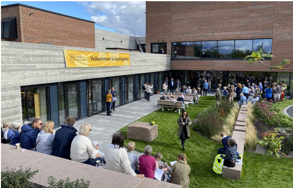
Fra åpningsfesten for det nye parkanlegget og torget utenfor Teglen.