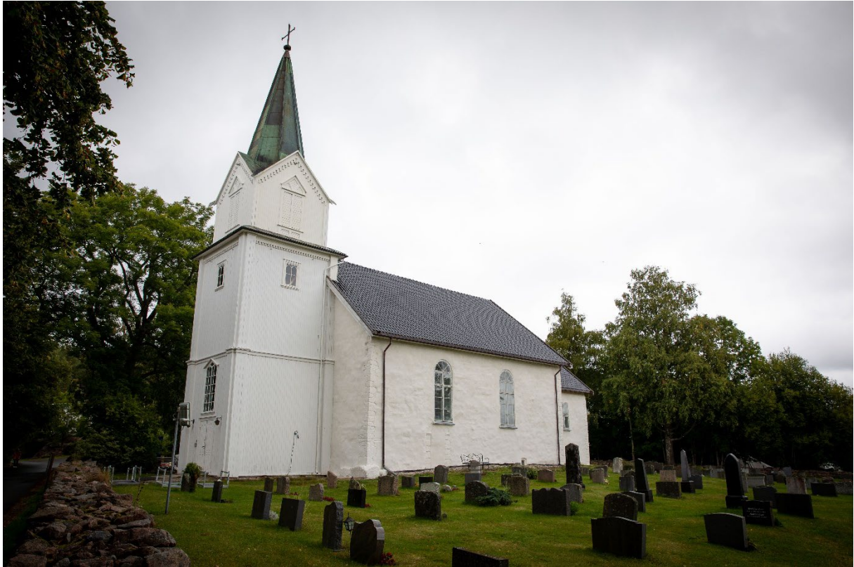
Hurum middelalderkirke er Asker eldste bygg. Snart kommer boken om kirkens historie gjennom nesten 900 år.

Alt henger sammen med alt, og selv om denne unike kirken – Asker aller eldste bygg – selvsagt må bevares som et kulturminne, så gleder det meg enda mer at kirken nå står rustet for å bevare og styrke sin plass i lokalmiljøet – som folkets hellige rom. Det er jo fantastisk at Asker kirkelige fellesråd har fått til å åpne nå, fortsatt midt i en krevende oppussing, men det er jo litt «typisk kirken» å få det til, mot alle odds.