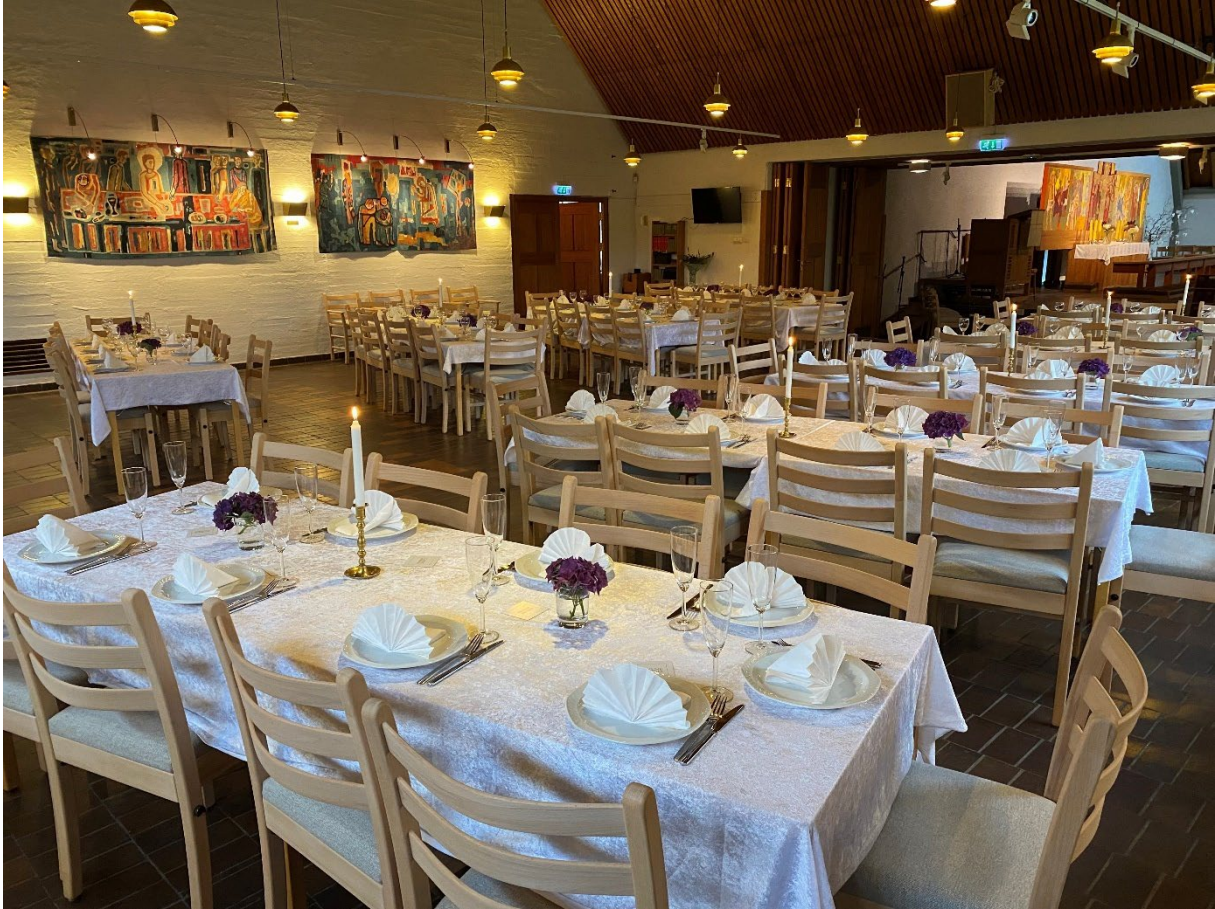
Bordene dekket til fest i menighetssalen for de mange frivillige i Holmen menighet.

I 2022 har menigheten i større og større grad kommet tilbake til normalen etter pandemiårene. Besøktallene på gudstjenester og aktiviteter er fortsatt litt under, men nærmer seg 2019-nivå.