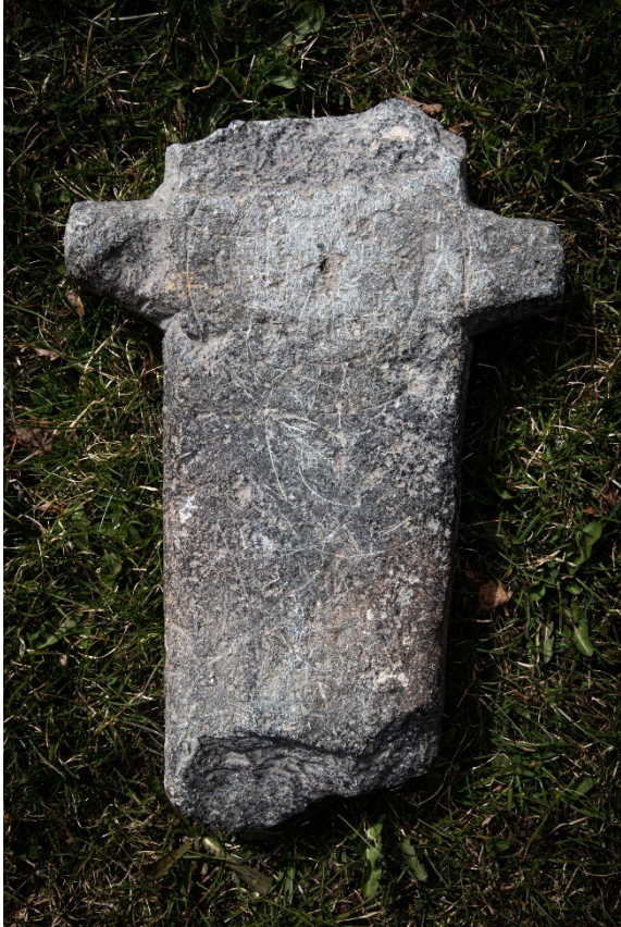
Klebersteinskorsene var gjemt og glemte i et halvt århundre.

Klebersteinskorsene er ikke det eneste «nye» gjenstandene som skal stilles ut i den nyrestaurerte kirka. Etter avtale med Norsk Folkemuseum, skal to historiske gjenstander tilbakeføres til Hurum kirke: Det gamle kirkeskipet fra 1700-tallet og Iver Huitfeldts kårde. Kirkeskipet er en detaljert skipsmodell, som hang fra taket i kirka fram til forrige, store restaurering i 1849. Skipet forestiller linjeskipet Danebrog, som Iver Huitfeldt hadde kommandoen over under slaget i Køge bugt i 1710. Huitfeldt er bisatt i gravkapellet ved siden av kirka, og fram til 1800-tallet lå den praktfulle kården han bar under sjøslaget oppå sarkofagen hans.