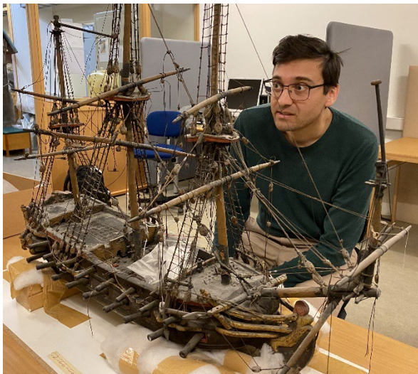
Artikkelforfatteren med det opprinnelige kirkeskipet fra 1720. Norsk folkemuseum vil nå låne det ut til Hurum middelalderkirke.

Klebersteinskorsene er ikke det eneste «nye» gjenstandene som skal stilles ut i den nyrestaurerte kirka. Etter avtale med Norsk Folkemuseum, skal to historiske gjenstander tilbakeføres til Hurum kirke: Det gamle kirkeskipet fra 1700-tallet og Iver Huitfeldts kårde. Kirkeskipet er en detaljert skipsmodell, som hang fra taket i kirka fram til forrige, store restaurering i 1849. Skipet forestiller linjeskipet Danebrog, som Iver Huitfeldt hadde kommandoen over under slaget i Køge bugt i 1710. Huitfeldt er bisatt i gravkapellet ved siden av kirka, og fram til 1800-tallet lå den praktfulle kården han bar under sjøslaget oppå sarkofagen hans.