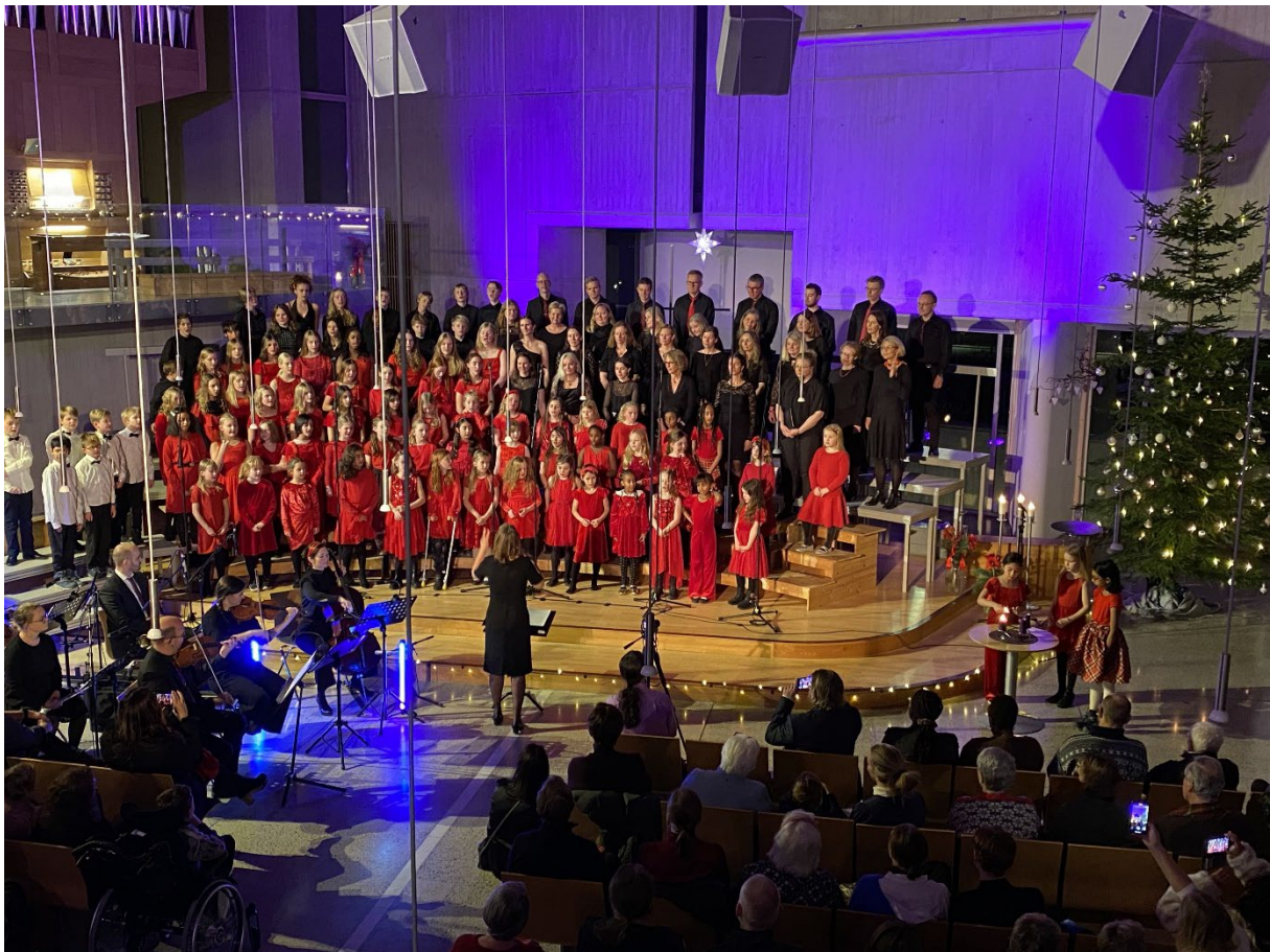
Fullt kirkehus under julekonsertene i Vardåsen.

I forhold til deltakelsen i daværende Asker, Hurum og Røyken var deltakelsen på julaften 2022 omtrent bare 2/3 av det samlede kirkebesøket som på julaften 2019. Det er likevel langt mer enn de to foregående årene med begrensninger i antall deltakere, men vi håper at terskelen i 2023 blir lavere for alle typer deltakelse etter hvert som vi får pandemien på avstand.