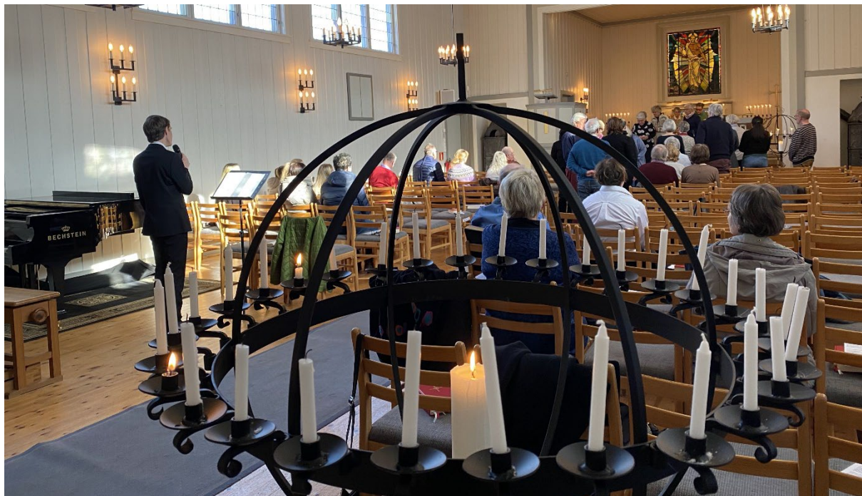
Søndagsgudstjeneste i Slemmestad kirke.