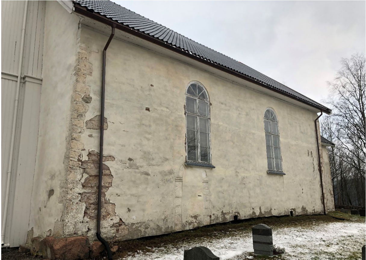
Kirkens mur mot sør – før (2020) og etter rehabiliteringen (2022).