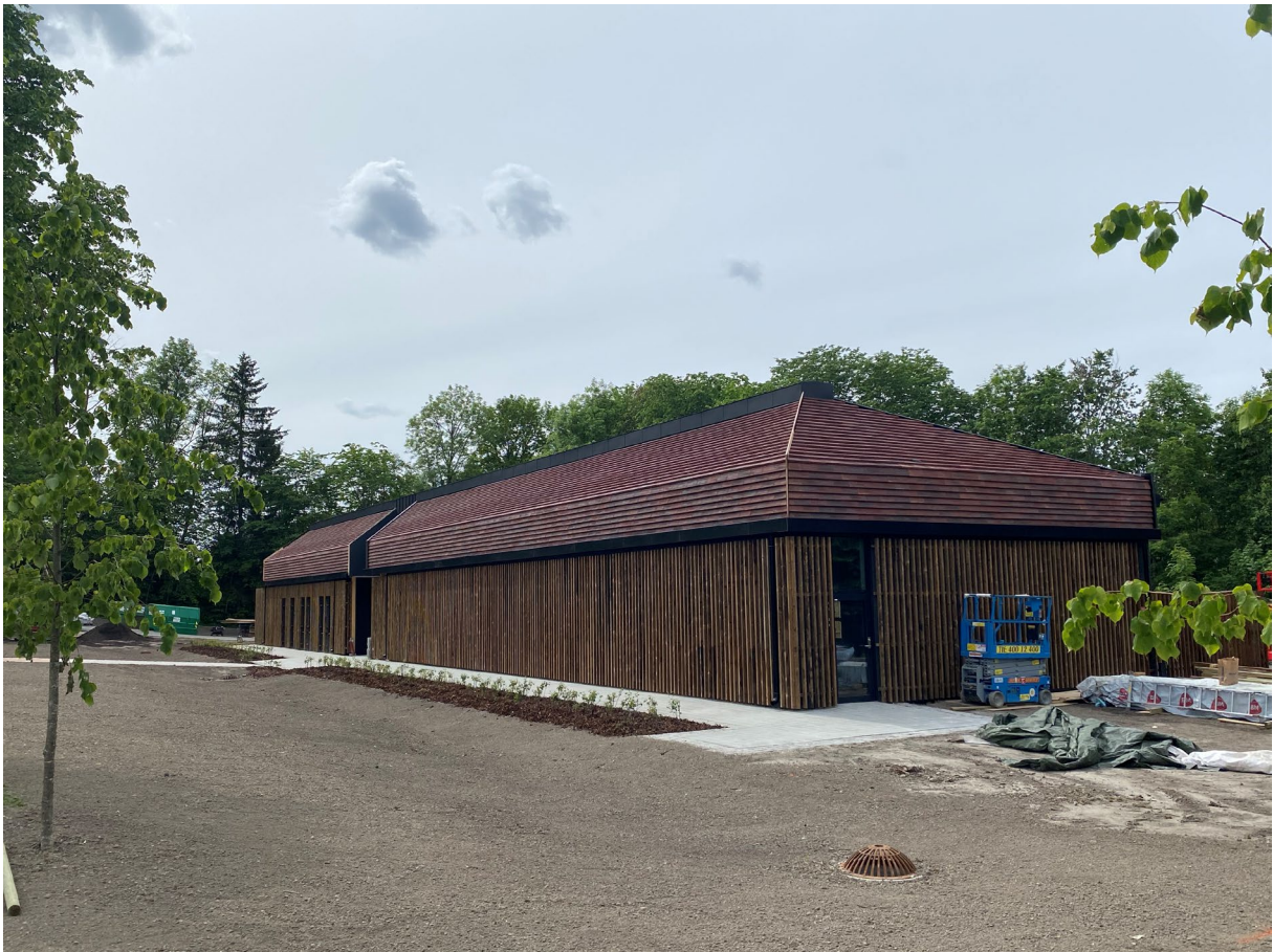
Bildetekst: Ny driftsbygningen ved Asker kirkegård ble ferdigstilt og gravplassavdelingen flyttet inn i de nye lokalene juli 2022. Bildet er tatt kort tid før åpningen.