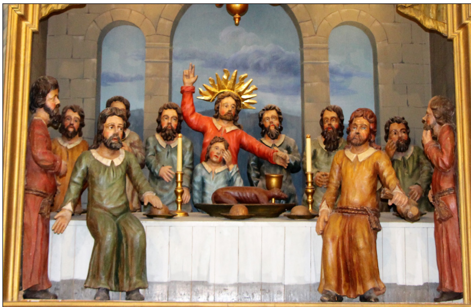
Påskemotiv i Asker kirkes altertavle.

Kirkeskyss? Tlf. 91 153 563 før kl. 09.30.