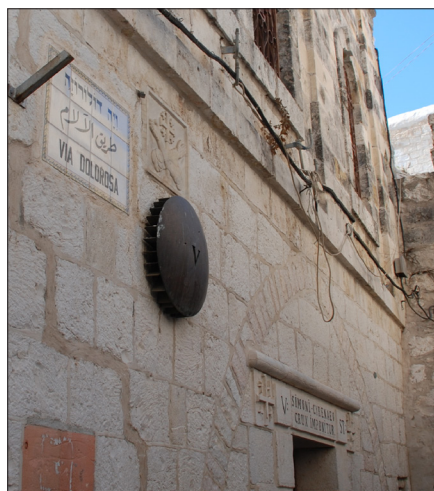
Via Dolorosa.