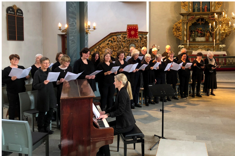
Korsang i gudstjenesten 4. mars i år.