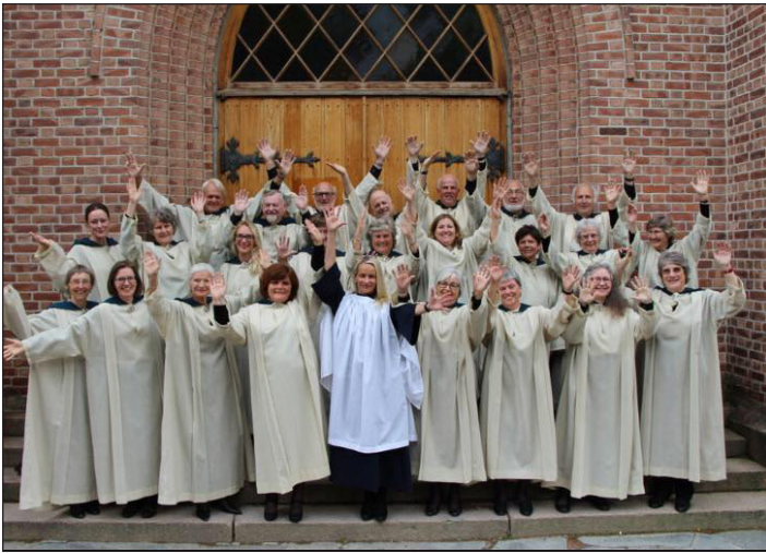
Et jubilerende kor i kirketrappa.

– Hvordan appeller kirkemusikk i vår tid? – Ved at musikk er et universelt språk! Den underbygger ordet, og kommuniserer der ordene ikke strekker til. Kirkemusikk er ikke en egen sjanger. Den er korsang og salmesang, liturgisk sang, orgelmusikk, bandmusikk, og i tillegg er den tilhørerens opplevelser i et hellig