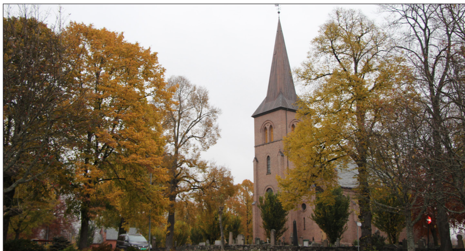
FARGEPRAKT. Asker kirke i høstmodus.