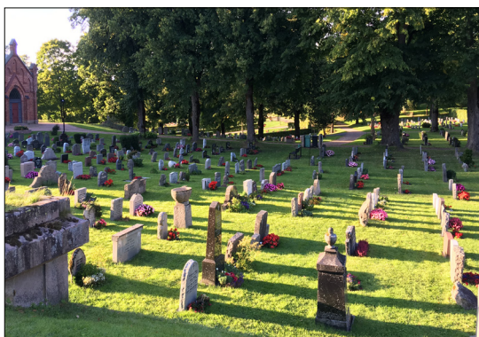
MØTEPlass. Asker kirkegård.

Ikke bare det. Allerede før Vårherre ble lansert på kristent vis i Norge, var mennesker i Asker godt kjent med hvordan livets store hendelser lot seg markere på dette stedet. En synlig rest, er gravhaugene fra jernalderen.