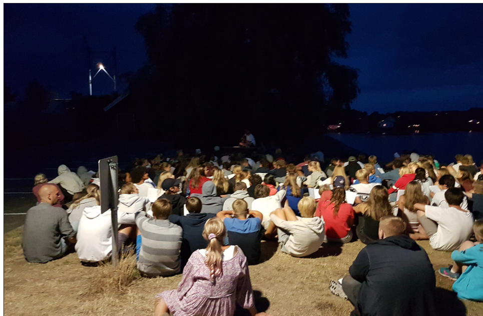
KVELDSBØNN. Hver kveld møttes konfirmantene i sjøkanten på Risøya.