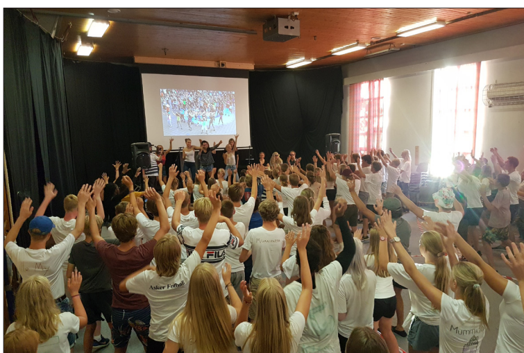
ALLSANG. Lett gymnastikk med armer i været og artig allsang, får faktisk morgentrotte leirungdommer ut av dvalen og inn i dagen.

Et «Alphakurs» starter i Vardåsen kirke tirsdag 25. september kl. 19.30. Kurset er en slags trosopplæring for voksne, og det blir ti-tolv kveldssamlinger med undervisning, måltidsfellesskap og samtale, dels i høst, dels etter nyttår. Kontaktperson: sokneprest i Vardåsen, Dag Håland: dh545@kirken.no.