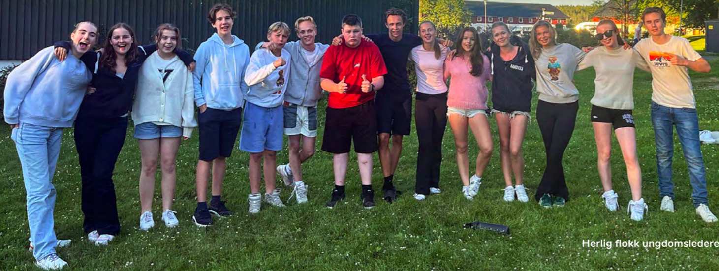
Herlig flokk ungdomsledere!