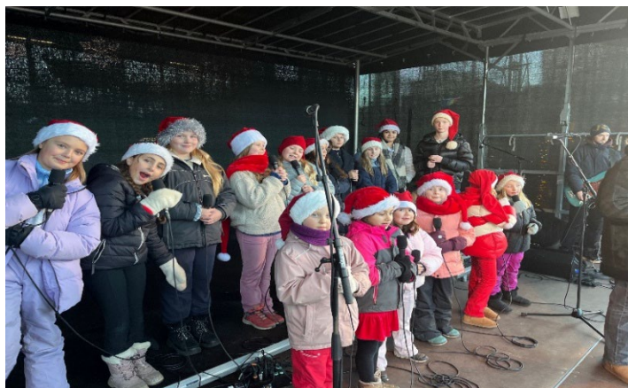
Lydprøve før julegrantenning i Asker sentrum.