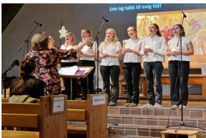
Fra kirkens 60-års jubileumsgudstjeneste 30. november 2025.