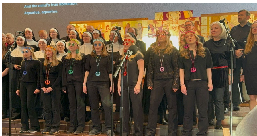
Stor musikalkonsert på våren.