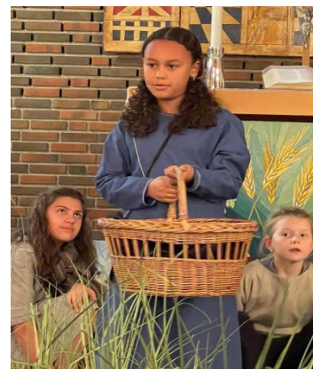
Fra Miriam i Rødtvedt kirke.