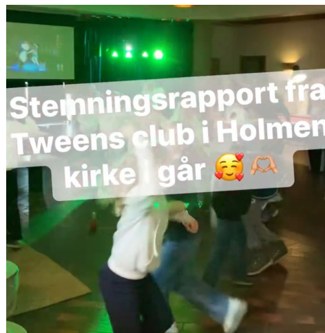
God stemning på Tweens!