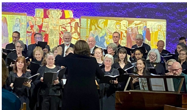
Rossinis Petite Messe Solennelle med HMV og Ås kirkekor.