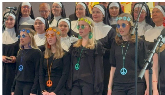
Nonnekleddede DE med Serafene i forkant. Fra musikal-konserten 6. april.