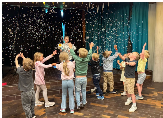
Føsteklassen med alle skolestarterne.