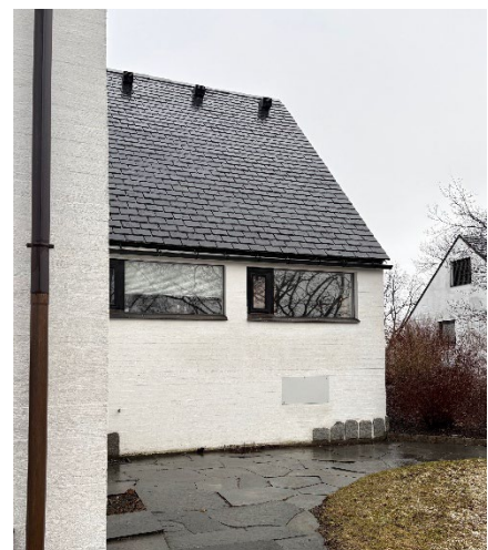
Fin, hellelagt plass i hjørnet utenfor speiderhula så dagens lys igjen i 2025.