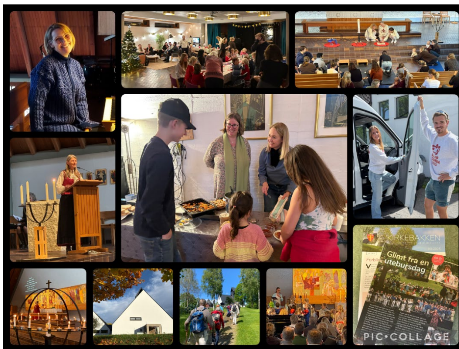
Flere glimt fra året som ligger bak.