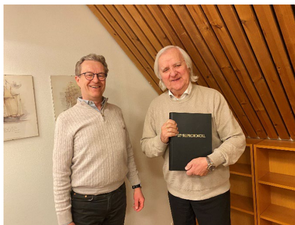
Overlevering av styreprotokoll fra avtroppende til påtroppende styreleder, april 2025.