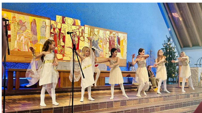
Dansende engler i julespillet på julaften.