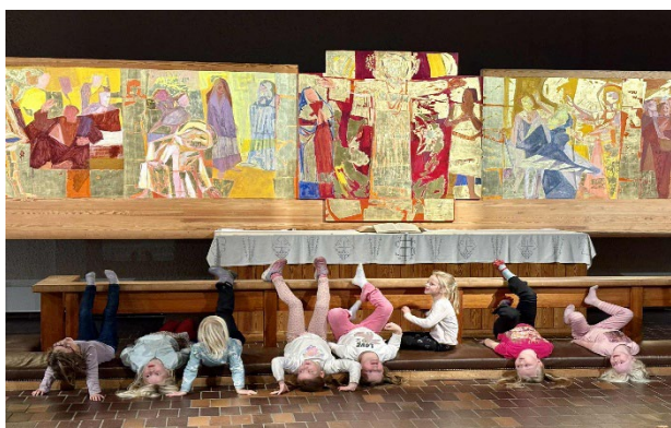
En helt vanlig korøvelse for aspirantene.