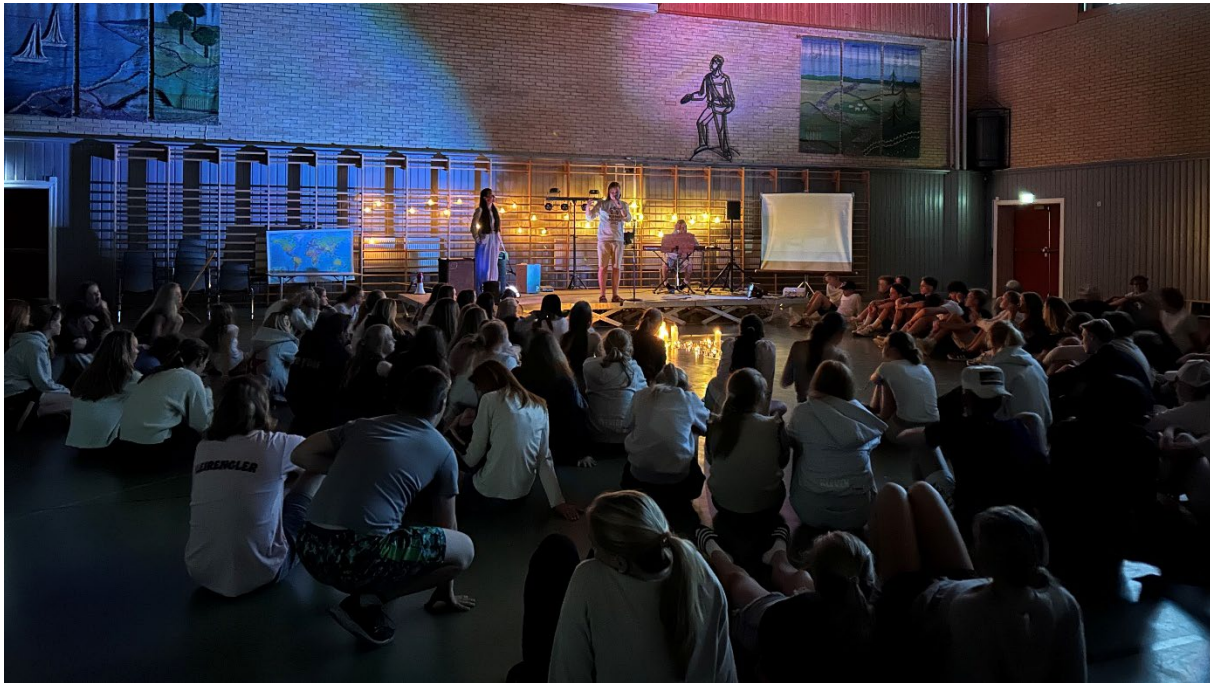
Fra «skumrings» kveldssamling under konfirmantleiren på Tomb.