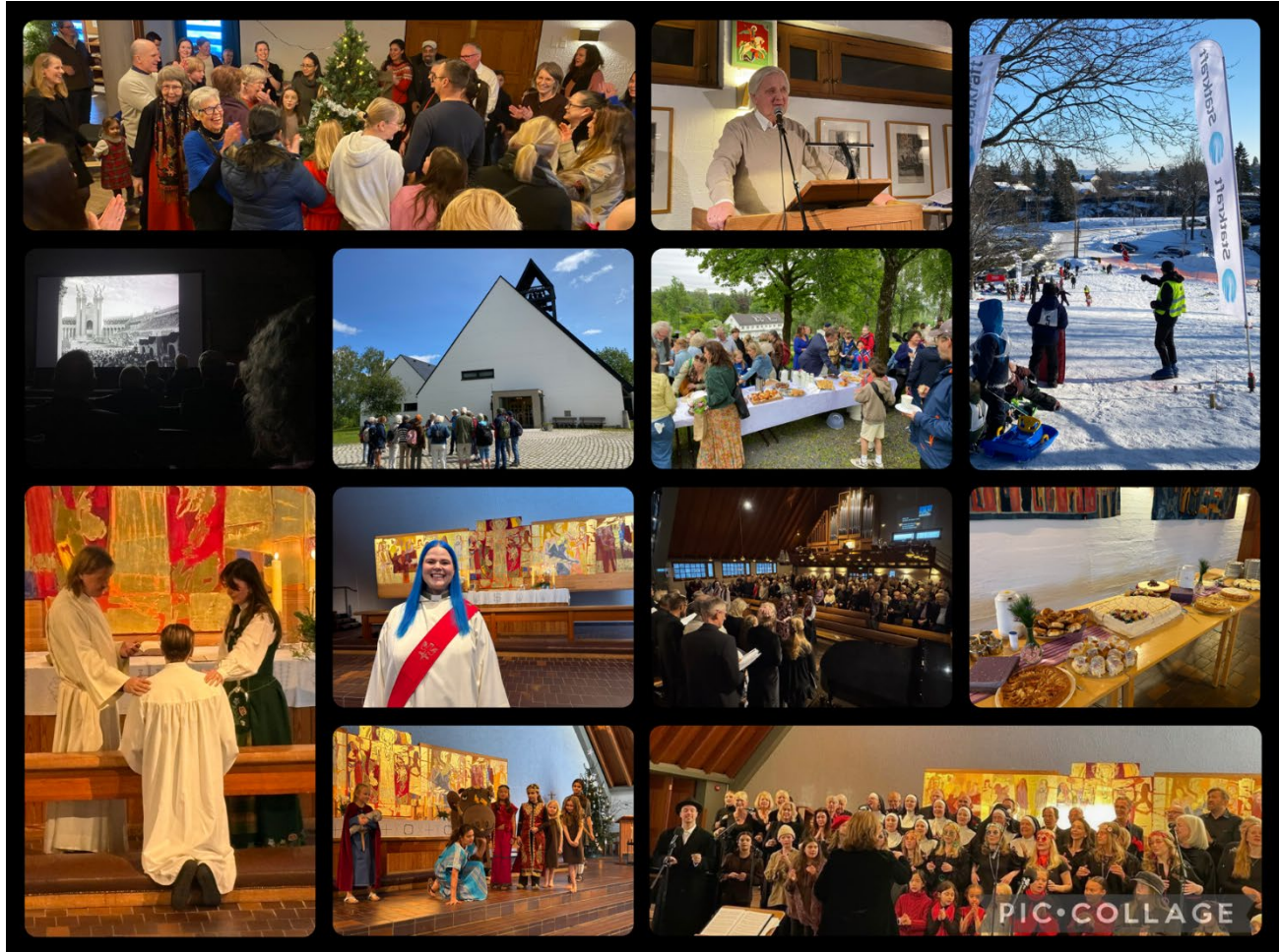
Noen få inntrykk fra litt av alt som har skjedd i 2025.

Asker kommunes økonomi blir stadig strammere, og dette går også ut over kirkelig tildeling. Asker kirkelige fellesråd (AKF) har over flere år fått redusert overføring fra kommunen, og ytterligere kutt vil bli realiteten for både 2026 og 2027. Fellesrådet har vedtatt flere tiltak for å møte situasjonen, blant annet redusert strømforbruk, økt bruk av vakanser, begrenset bruk av vikarer og bemannings-tilpasninger ved naturlig avgang. Til tross for reduserte økonomiske rammer står målet fast: å bruke tilgjengelige ressurser til beste for kirkens samfunnsoppdrag i hele Asker, slik vi vi kan lese det i AKFs årsrapport 2025.