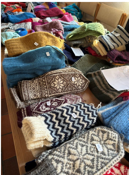
Litt av bidragene våre til Førjulsessen.