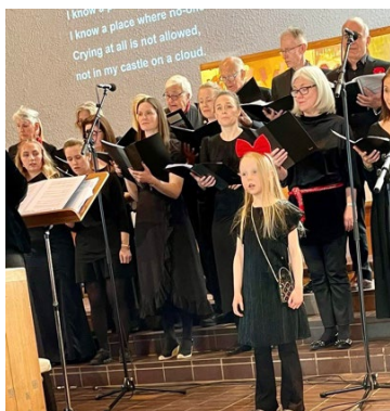
Musikalkonsert i Holmen kirke.