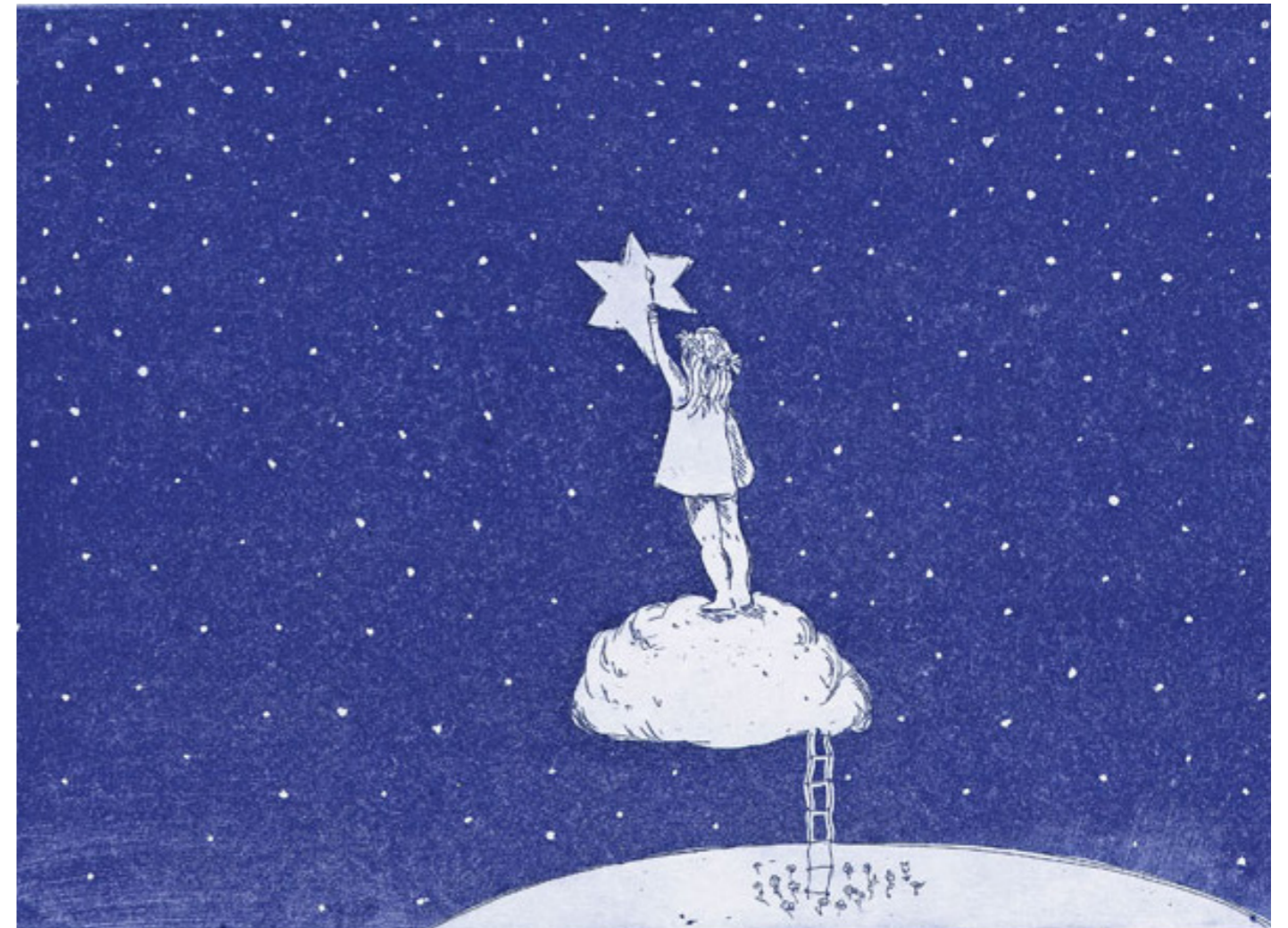
Illustrasjon: Bjørg Thorhallsdottir/www.bjorgsunivers.no