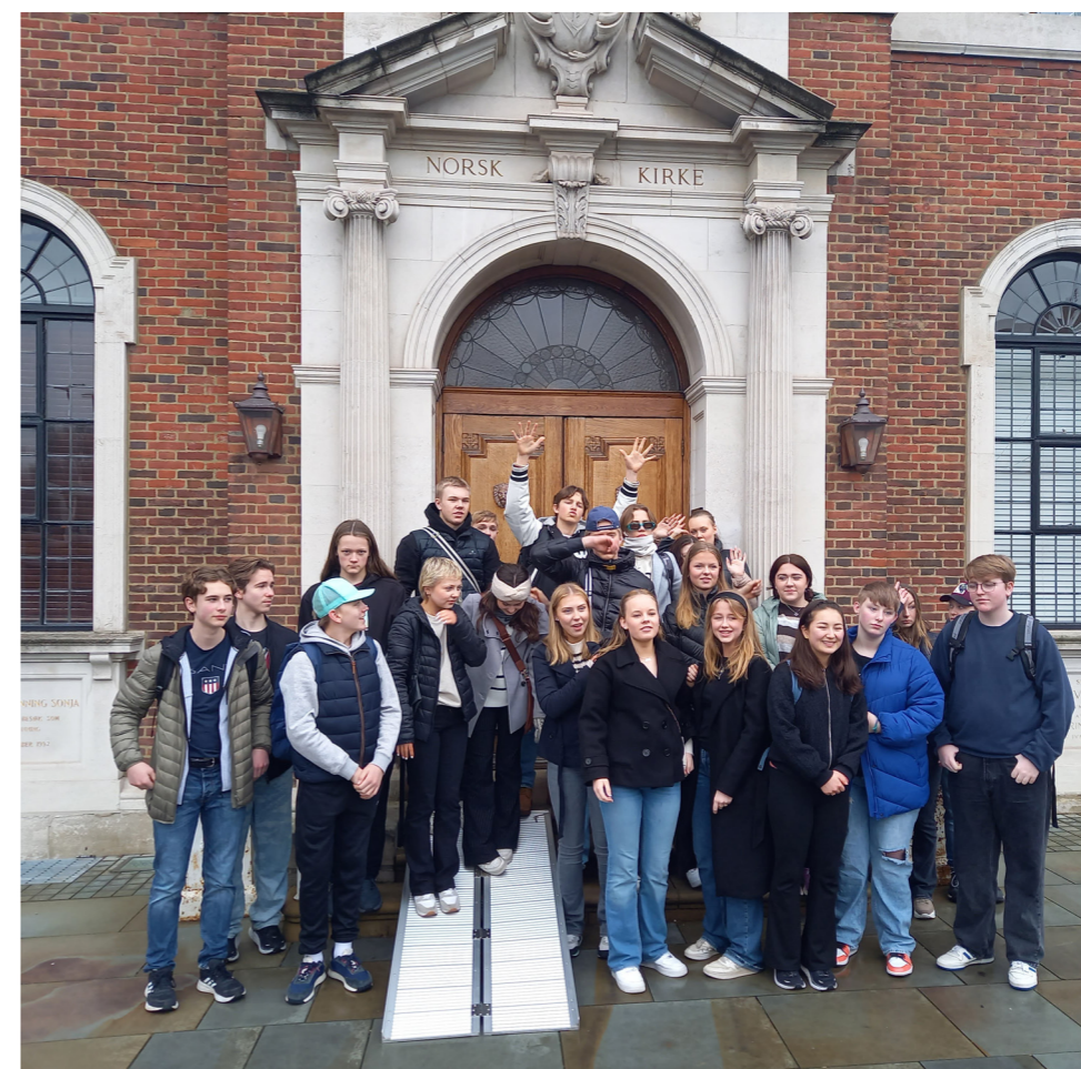
Alle deltagerne utenfor Sjømannskirken i London.