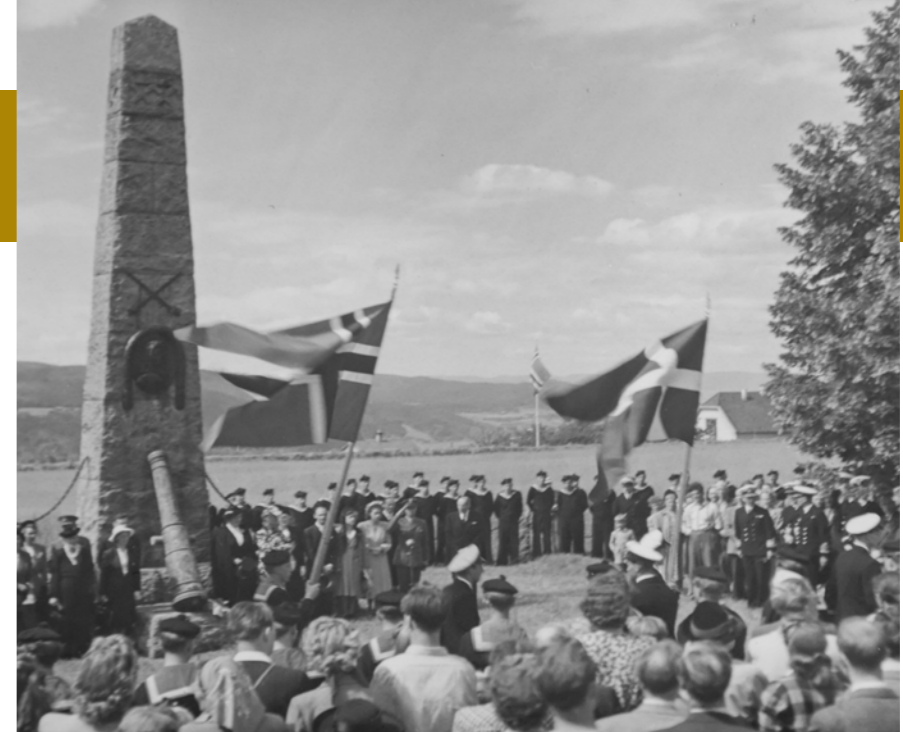
Fra den høytidelige gjeninnvielsen av gravkapellet i 1948. Den danske og den norske marine var representert. Her sees blant annet de to fanene, hvor den ene stangen er fra 1710 og fra skipet Huitfeldt.