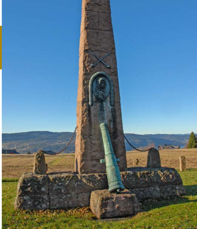
Foran Hurum kirke står en bauta av drammensgranitt med et bronserelieff av Iver Huitfeldt. Den ble reist i 1910, til 200-års-jubiléet for slaget i Køge bukt. Kanonen, som bærer navnet «Halvdan Frodesson» er en 14-punder fra Christian IVs tid, som ble berget fra vraket av Dannebrog i 1874.