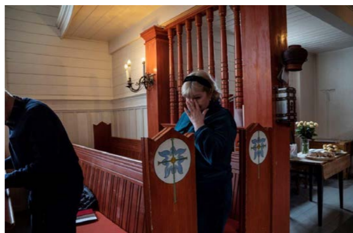
Det ble et sterkt gjensyn for mange...