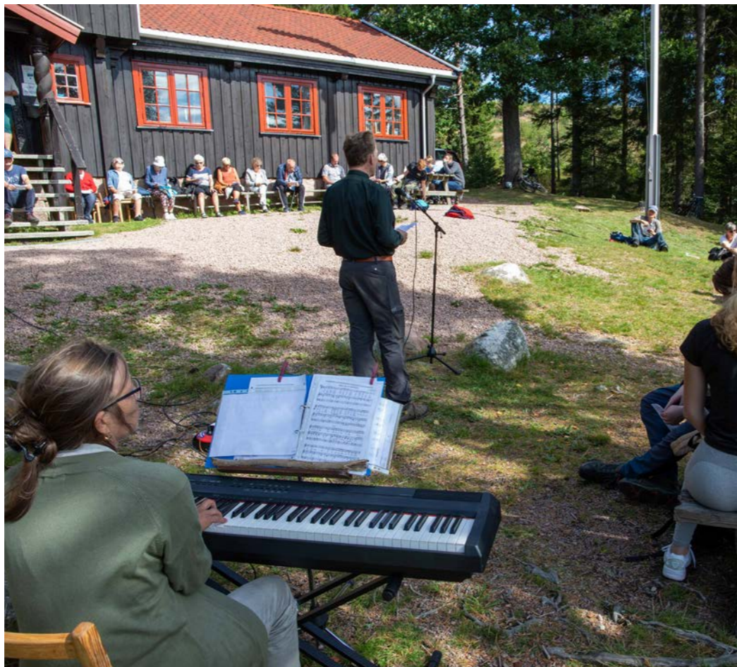
Gudstjenesten ved Stikkvannshytta begynner kl 12.

Representanter fra Hurum historielag forteller underveis om hvordan folk levde under enkle og fattige kår, om folk på kirkevei til Mariakirken på