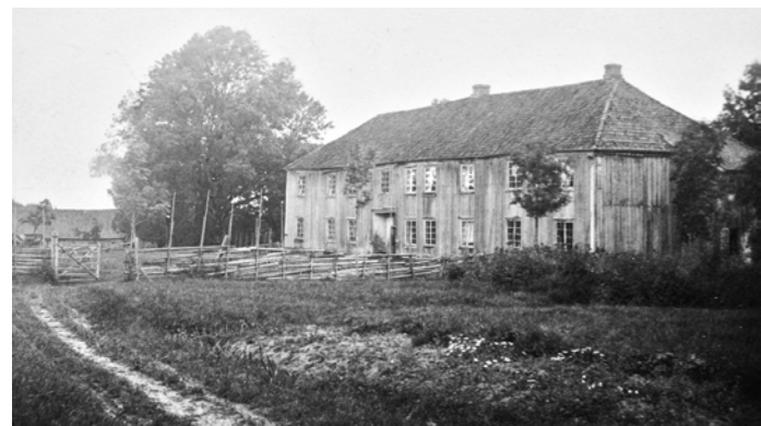
Gammelt foto fra 1899 av Tronstad gård med hovedbygningen som ble revet i 1899.