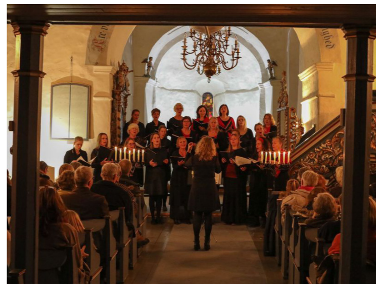
Coro Angelico - Hurum kirke 24. desember

Søndag 7. januar kl. 16.00: Juletreff (Helligtrekongersfest) på Tofte menighetshus.