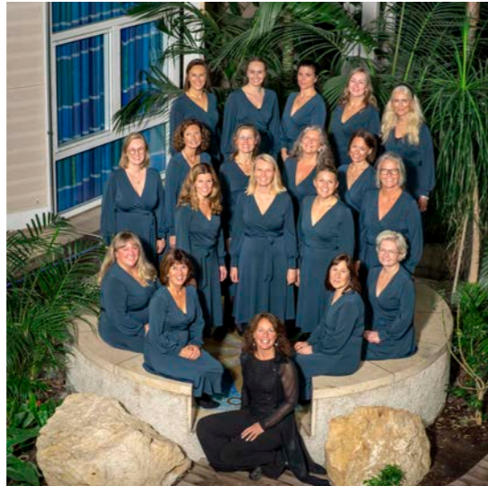
Sætre vokalforum - lille julaften i Hurum kirke.