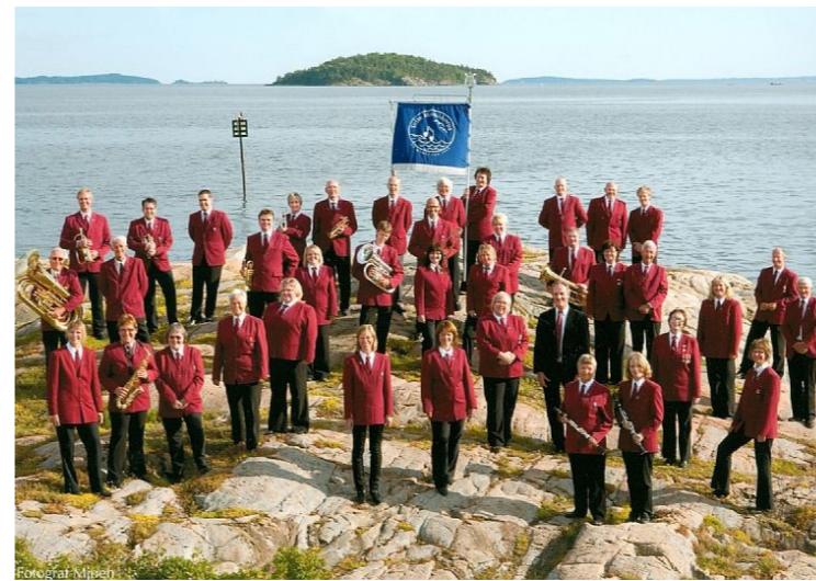
Tofte musikkorps - Filtvet kirke 11. desember.