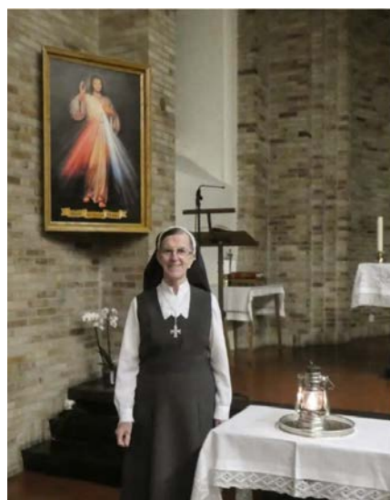
De siste årene har flammen fra Betlehem brent permanent i Norge, hos søstrene i Marias Minde i Bergen og hos St. Elisabethsøstrene i Oslo.

Speidere arbeider for fred og forståelse mellom mennesker. Det er de som nå er barn og unge skal bygge fremtiden. Fredsbudskap og Fredslyset er fast inventar på mange speiderlysmesser, spesielt i november og desember.