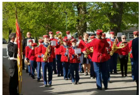
Sætre og Folkestad skolekorps - Holmsbu kirke 9. desember.