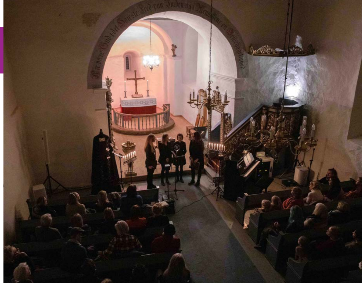
Førjulsconcert i Hurum kirke 10. desember med en rekke medvirkende.