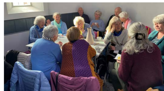
Praten gikk livlig ved bordene i Kirkestua under formiddagstreffet