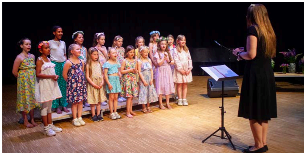
Sætre barnekor - Kongsdelene kirke 8. desember.