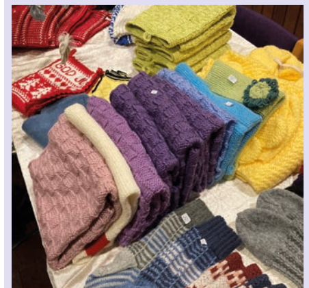
FØRJULSMARKED: Sett av lørdag 9. november til en hyggelig dag i Østenstad kirke.

Velkommen til en hyggelig lørdag i kirken vår. Her finner du gode produkter innen håndarbeid og hjemmebakkeri, et stort hovedlotteri, boksalg, salg av finere lopper, kakelotteri og nystekte sveler – og mye mer på kirkebakken.