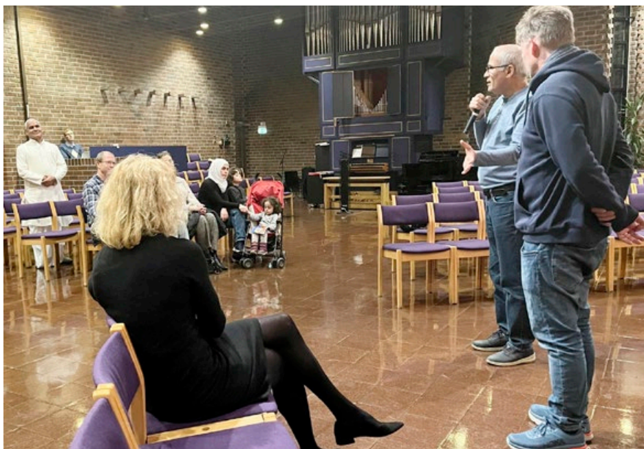
HYGGELIG BESØK fra Hindutemplet i Slemmestad på den internasjonale festen i Østenstad kirke.