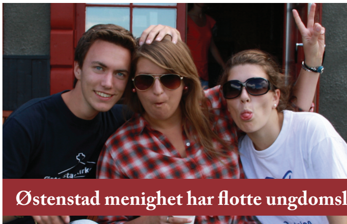
Østenstad menighet har flotte ungdomsledere