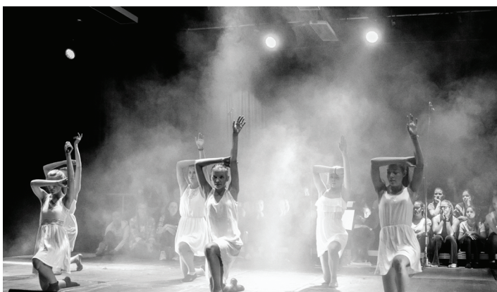
Fra fjorårets musikal av Pappas barn.