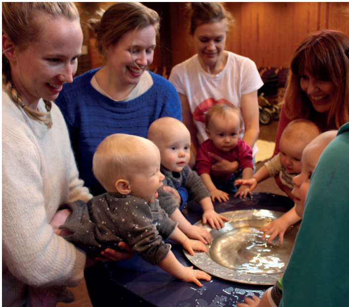
Babysang i Østenstad kirke er koselig for store og små.