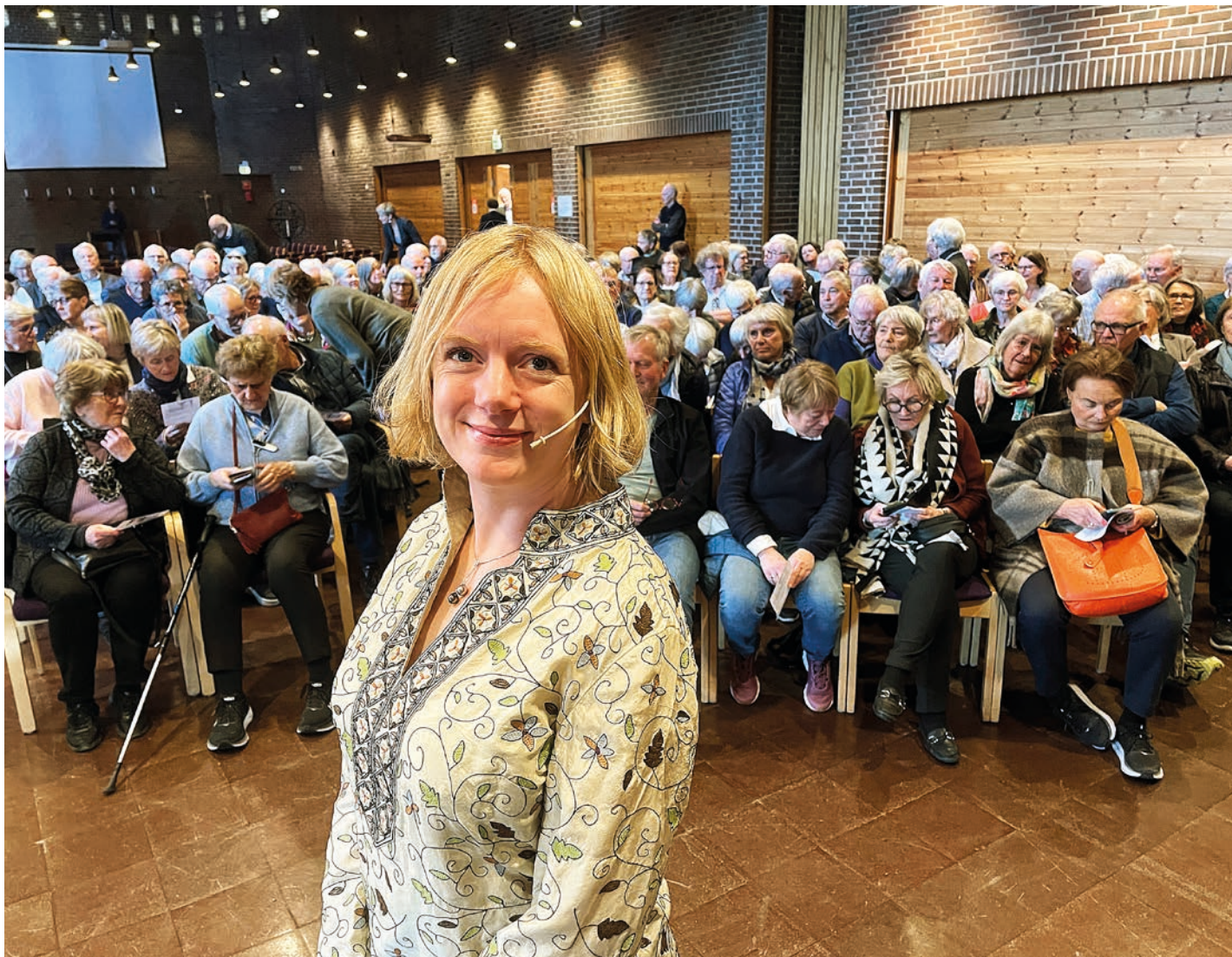
STORT OPPMØTE: 250 interesserte møtte opp på Østenstad Y's Mens kulturkveld for å høre forfatteren Erika Fatland fortelle om sin lange reise og eventyrlige opplevelser på ferden langs Russlands yttergrense.