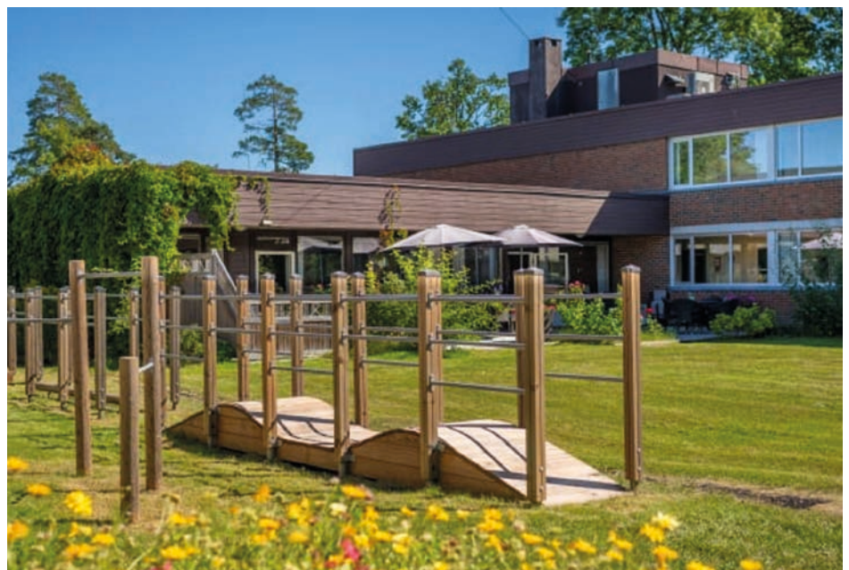
HAGEPROSJEKT: Bondi boligsenter har 35 leiligheter med service for eldre – og en flott hage.

– Vi trenger frivillige til å få i gang et hageprosjekt, være med å utvikle ideer, dyrke blomster, urter og bær som beboerne kan stelle og benytte i samarbeid med frivillige. Ta gjerne kontakt med oss på mobil 940 12 706.