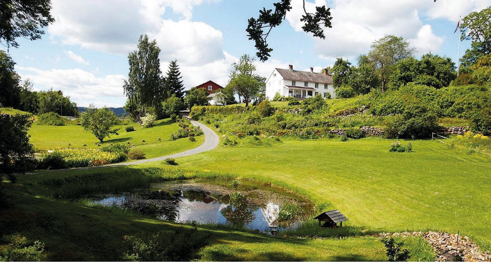
EN PERLE: Familien Rustad stiller vakre Løkenes gård til disposisjon for vandringsgudstjenesten 16. juni.